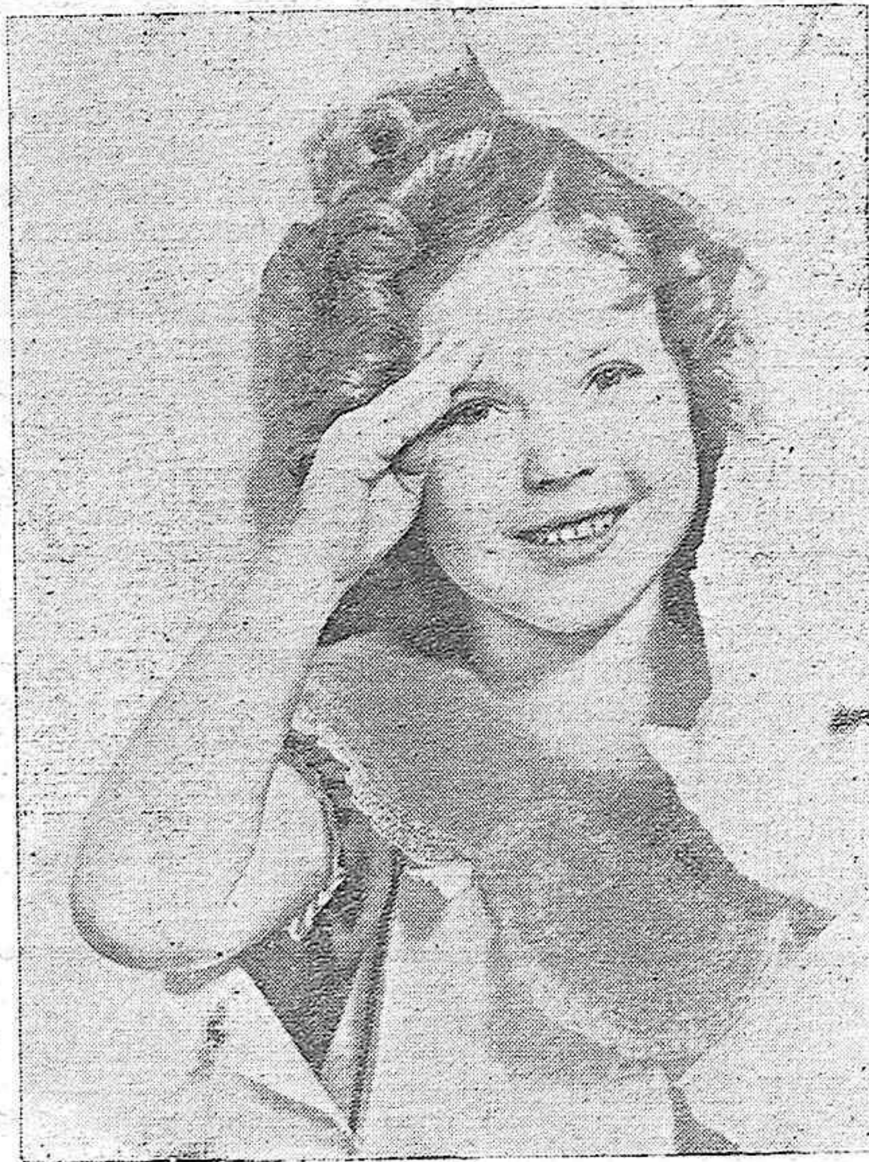
La encantadora y precoz actriz del Cinema mundial Shirley Temple, que ha obtenido los más resonantes éxitos en la pantalla y que es protagonista de la gran película "Rebelde" que se exhibe en el Gran Teatro