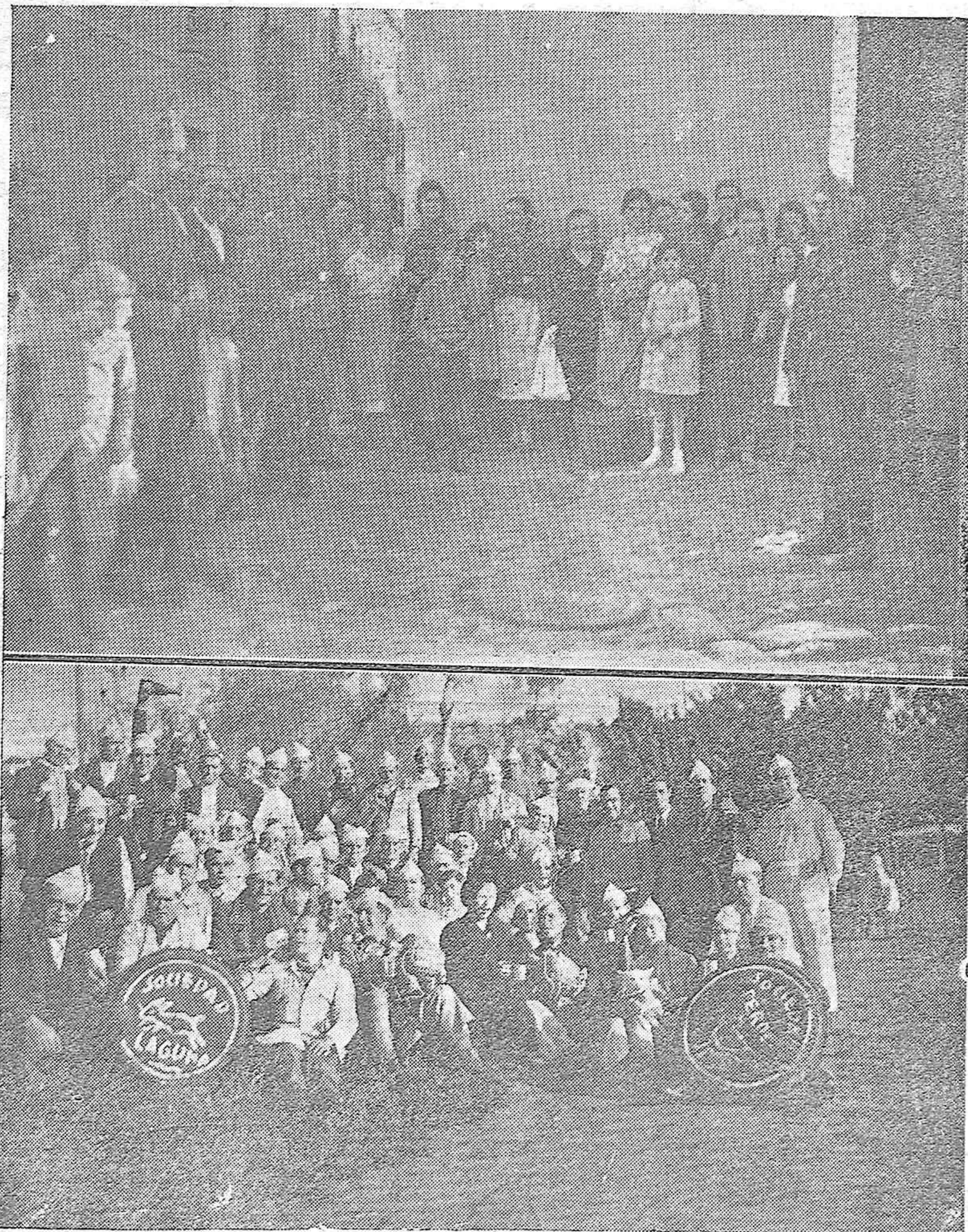
Una de las innumerables "colas", que con motivo de la pasada huelga, se formaron ante las puertas de las panaderías.—La cordobesa sociedad denominada "Los 58", en su última excursión "perolística", celebrada en el Puente Mocho