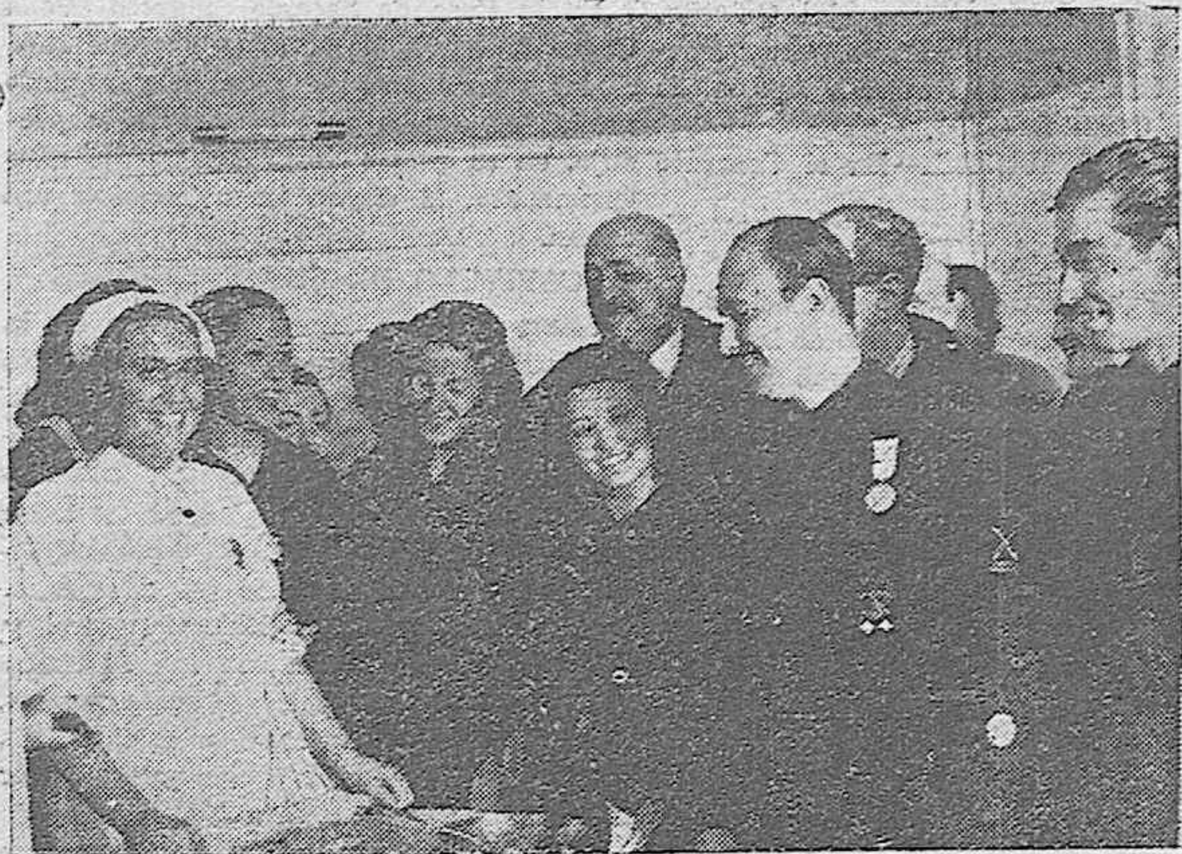
Pilar Primo de Rivera visita, en unión de las camaradas de la Sección Femenina, y otras jerarquías, una de las Escuelas del Hogar, recientemente inauguradas en Madrid

Redacción, Administración y Talleres FALANGE ESPAÑOLA TRADICIONA- LISTA Y DE LAS JONS Puerta del Rincón :-: Teléfono 2436 Apartado de Correos número 2