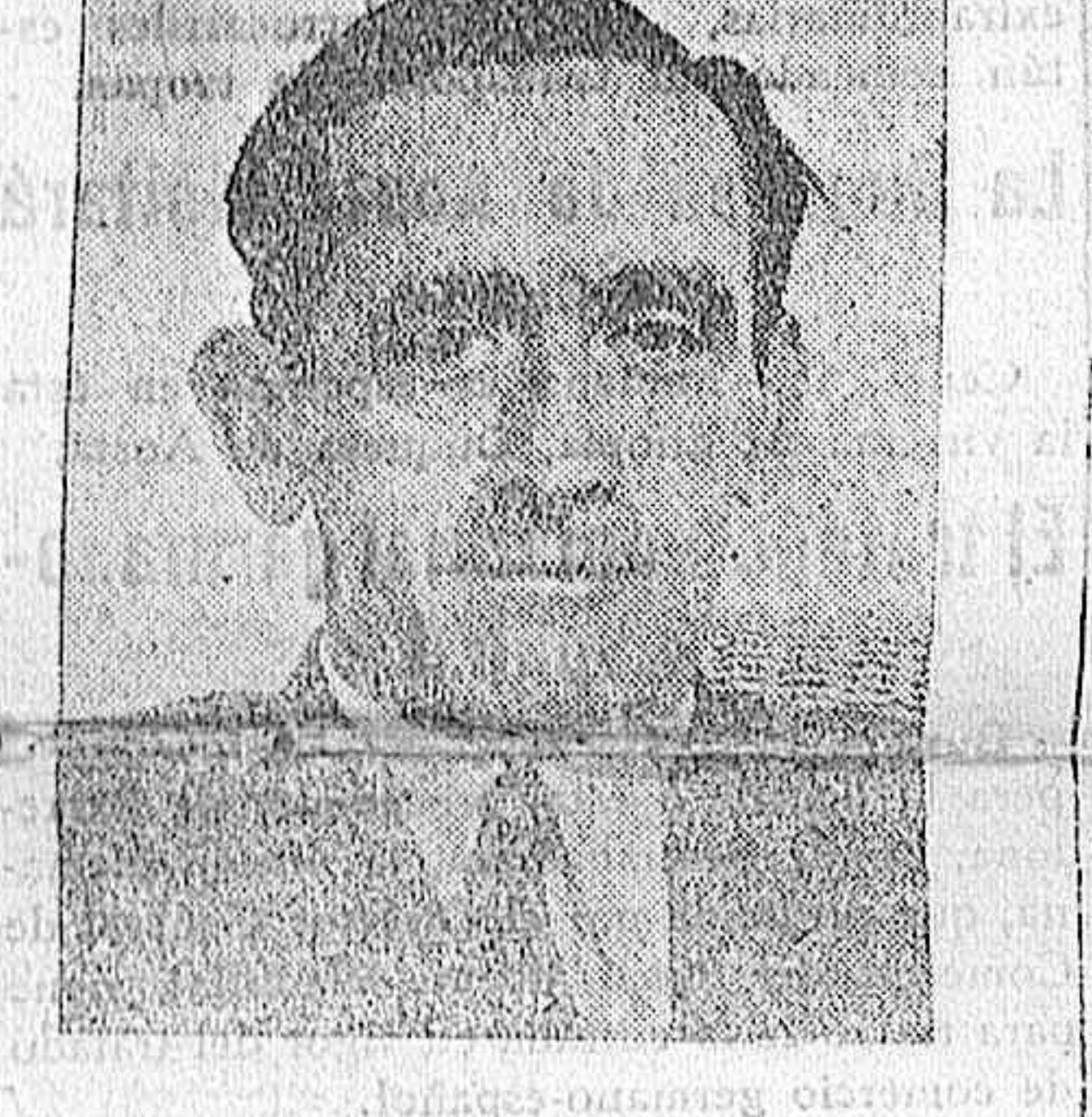
GENERAL DE BRIGADA DON AGUSTIN MUÑOZ GRANDE, SECRETARIO GENERAL DEL MOVIMIENTO, JEFE DIRECTO DE LA MILICIA DE FALANGE ESPAÑOLA TRADICIONALISTA Y DE LAS JONS, Y MINISTRO SIN CARTERA