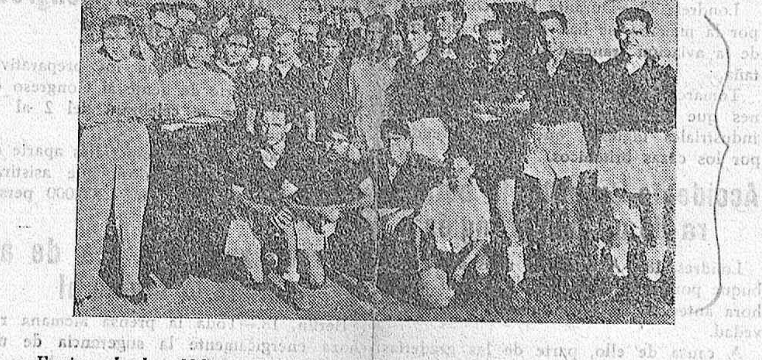
Equipo de las Milicias de Falange, vencedor en el partido celebrado en la Electromecánica contra la Unión Deportiva Ferroviaria.