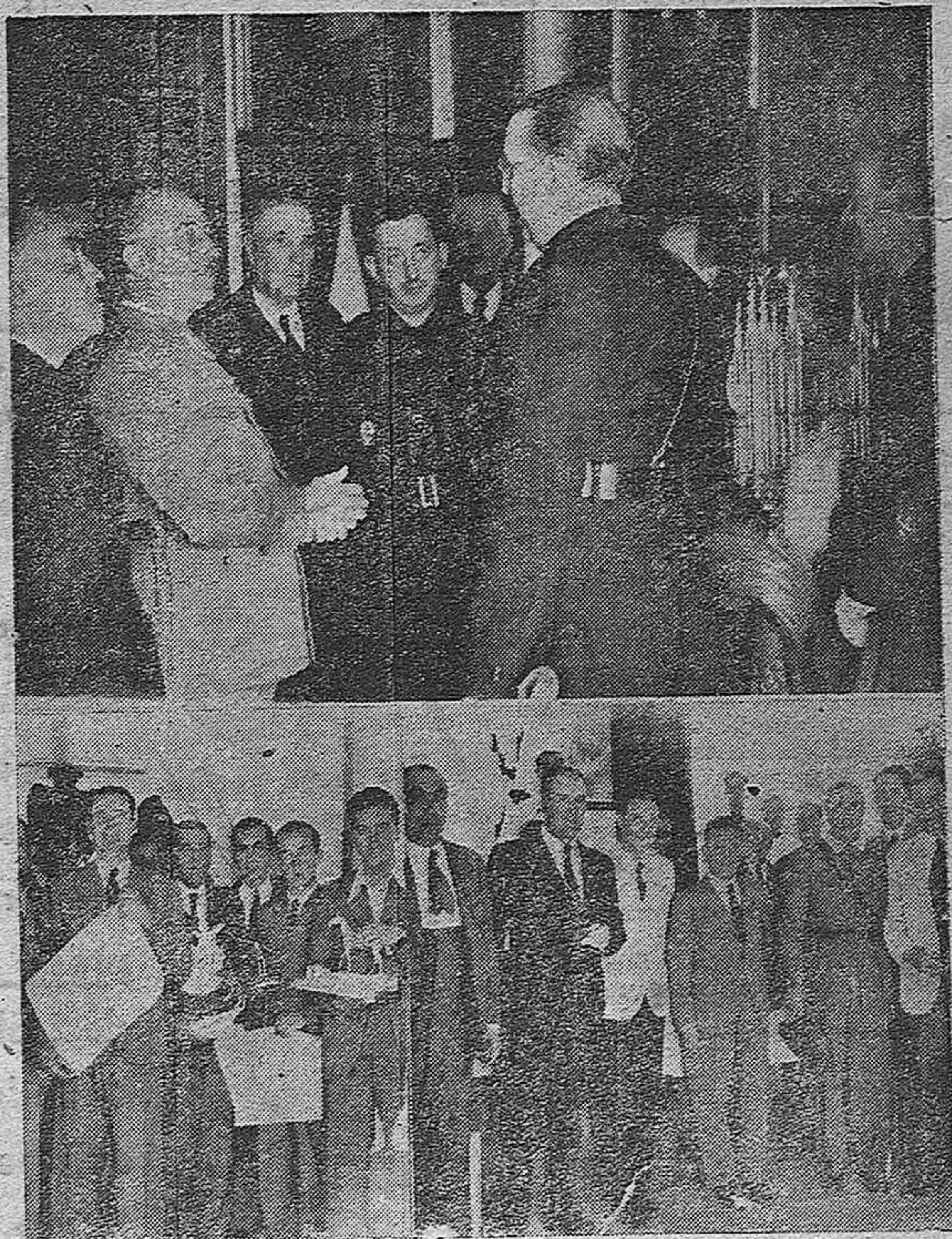
Tres fotografías de actualidad: Nacional, la primera; y local, las dos últimas.—El Candillo, rodeado de la comisión de arroceros valencianos, que le hizo entrega de una valiosa arqueta, símbolo de la «Cosecha de la Victoria».—Autoridades cordobesas y expositores, en el acto de la entrega de premios de la Exposición de Productos Industriales

Alemania en los últimos siete años de su reconstrucción, ha disfrutado de la ayuda de una poderosísima «quinta columna» dentro de las fronteras de las dos potencias que ahora se enfrentan con ella. En Francia se llamó el Frente Popular; en la Gran Bretaña, fueron el laborismo y los principios democráticos de tendencia marxista. Mientras Alemania empleaba cada momento para hacerse más fuerte, Inglaterra y Francia se desangraban alegremente sin percatarse del suicidio lento que cometían en sus propias hien-