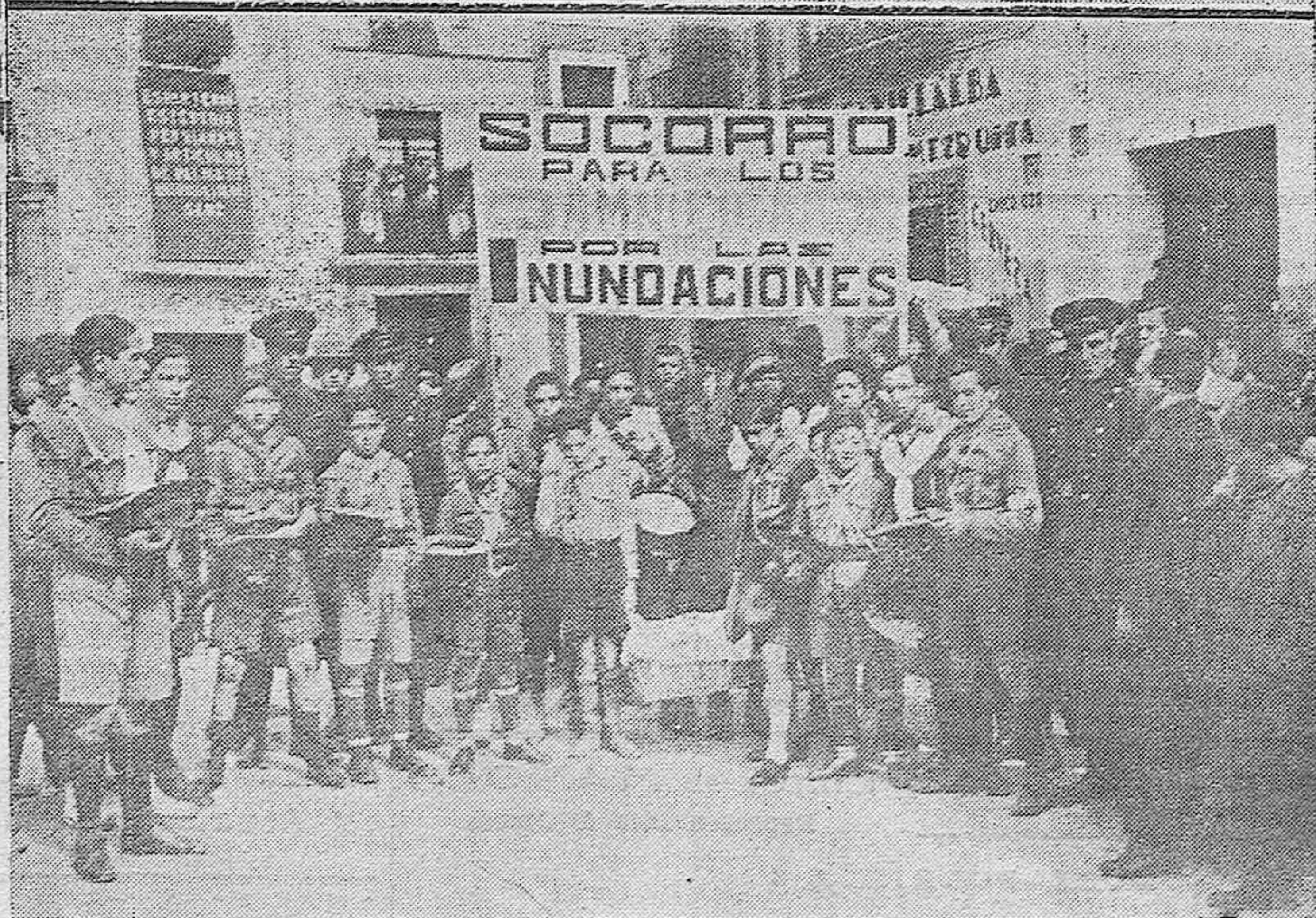
Bellas señoritas formando una simpática comparsa que tomaron parte en la fiesta de la Piñata.—Los exploradores cordobeses postulando por las calles de la capital para los damnificados a causa de los últimos temporales.