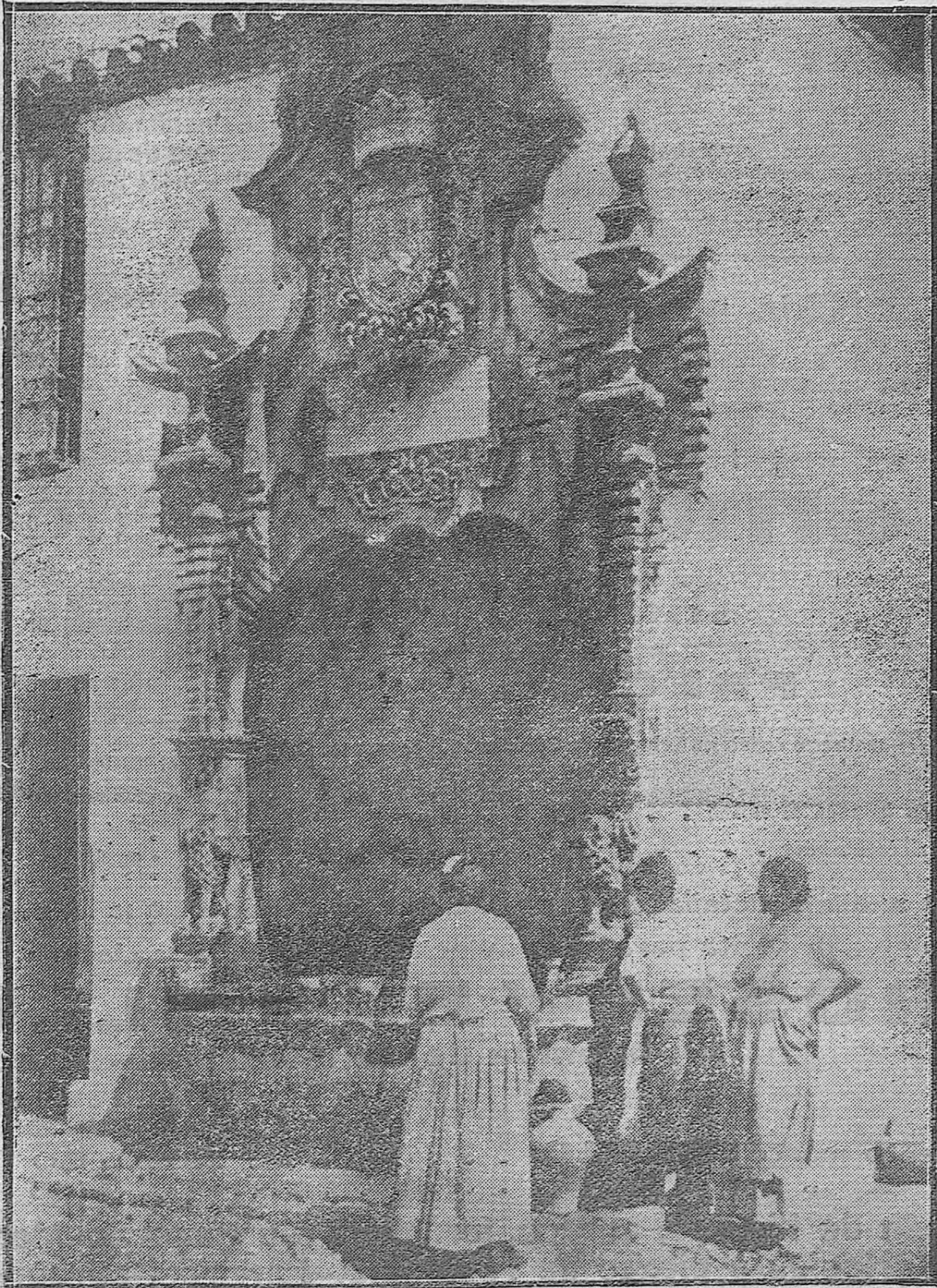
RINCONES DE CÓRDOBA.—LA TIPICA FUENTE DE LA PIEDRA ESCRITA.