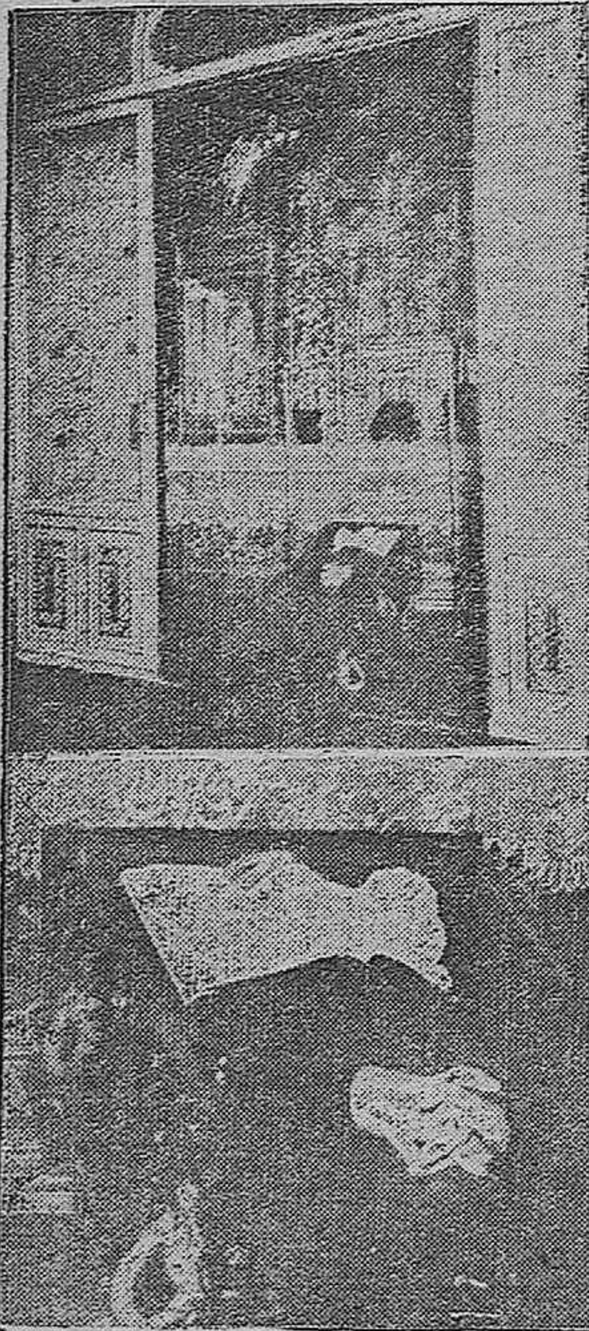
La capilla ardiente en el oratorio de la casa de «Guerrita». El cadáver del famoso extorero colocado en el féretro (AMPLIA INFORMACION DE LOS FUNERALES Y ENTIERRO, EN LA ULTIMA PAGINA)

La presencia de la mujer cordobesa, nota de gran emoción. Autoridades, jerarquías y representantes de la Grandza, en la comitiva fúnebre