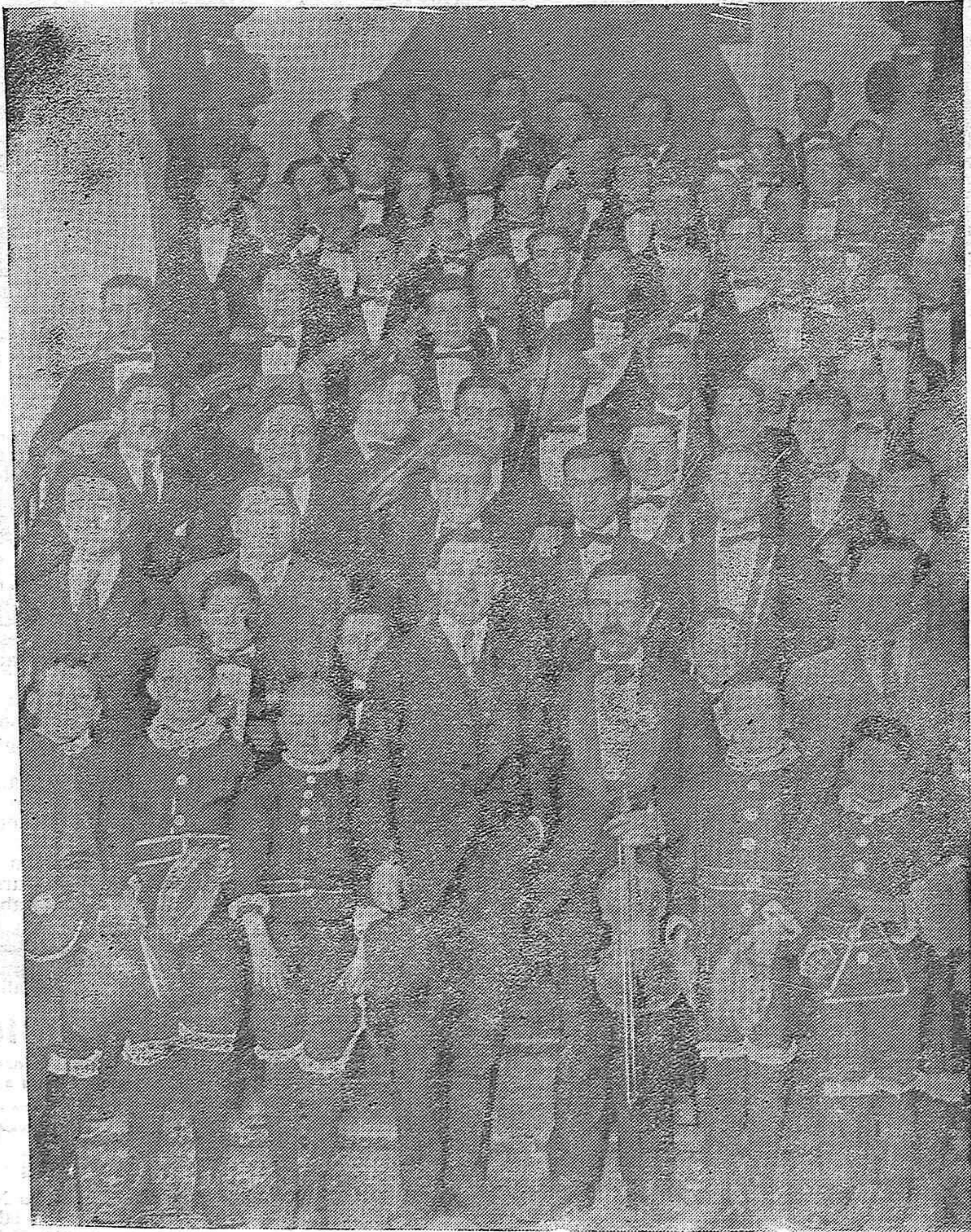
DISTINGUIDA AGRUPACION MUSICAL DE FERNAN NUÑEZ, QUE NOS HA VISITADO EN EL PRESENTE CARNAVAL