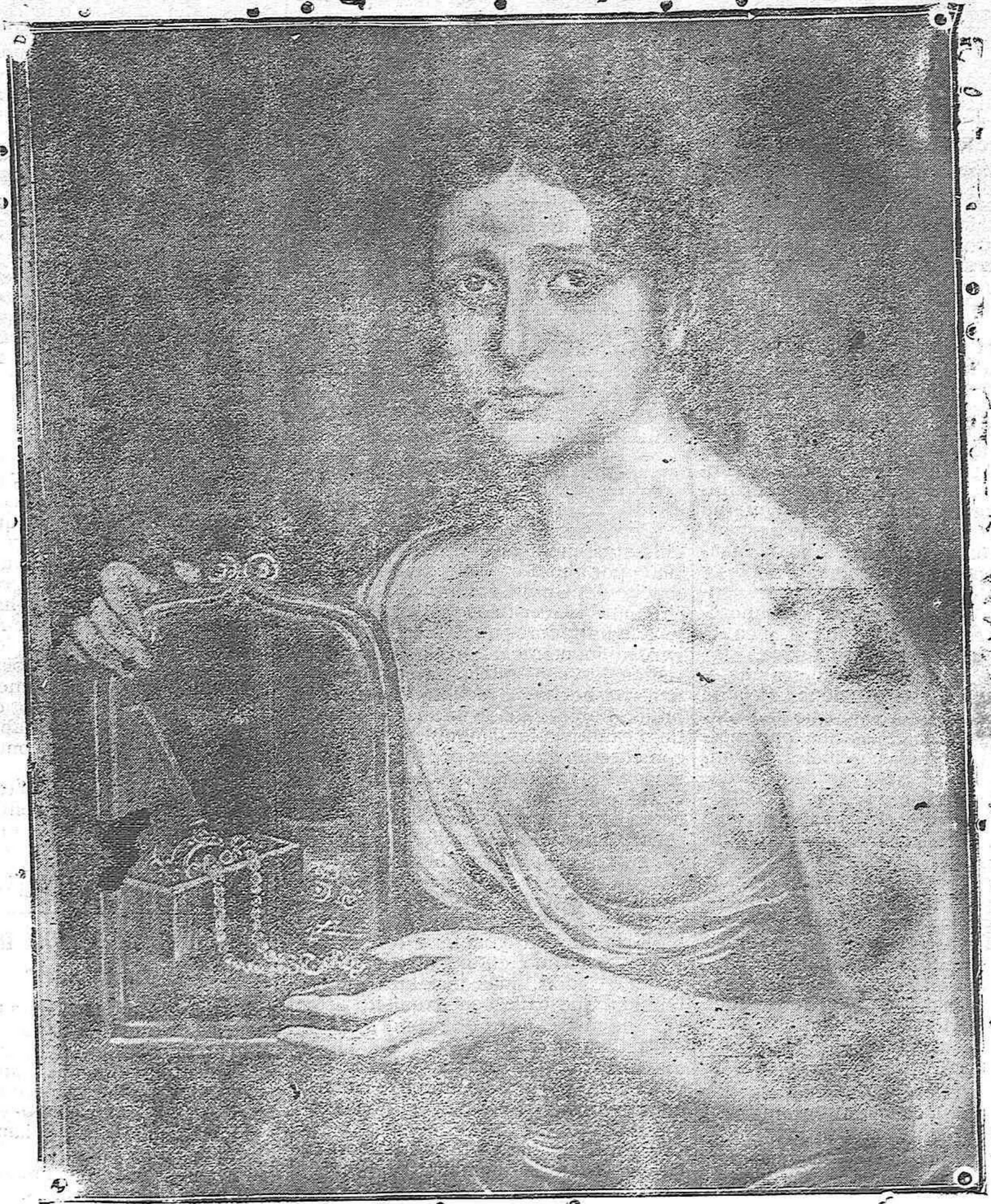
“LA DAMA DE LAS JOYAS.”—CUADRO DE ROMERO DE TORRES