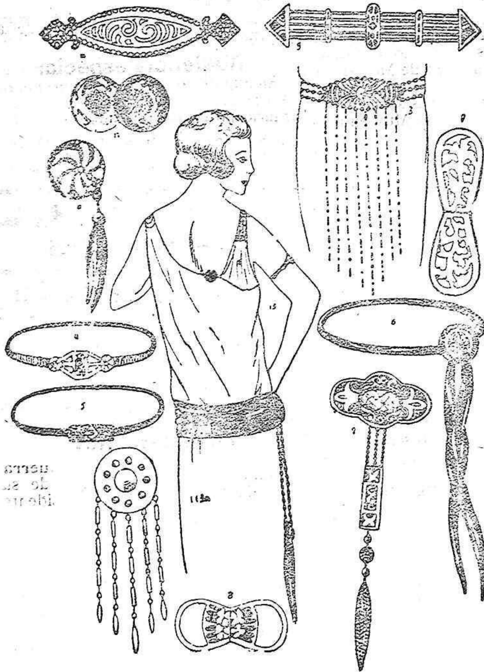
Fig. 1.—Un encantador ejemplar de galalith coral para sostener y conservar las colgaduras (drapés).

Fig. 10.—Ejemplar vieja plata y semejantes.