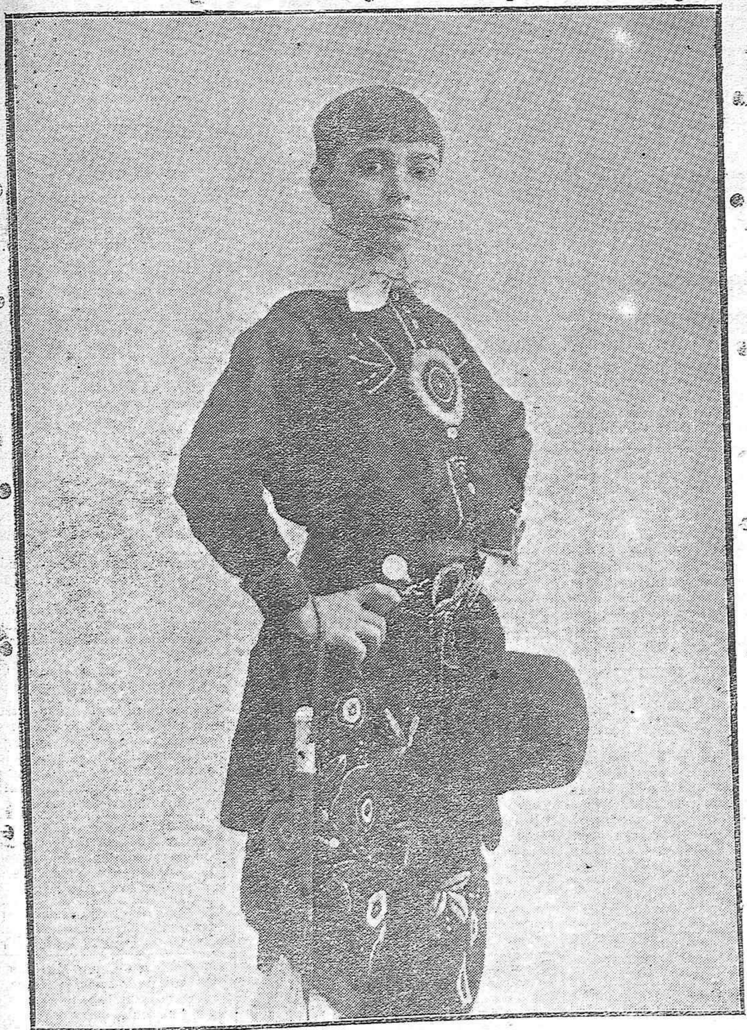
Narcisin, el genial y diminuto artista que ha sabido captarse la admiración del público cordobés y que con extraordinario éxito ha celebrado su beneficio.