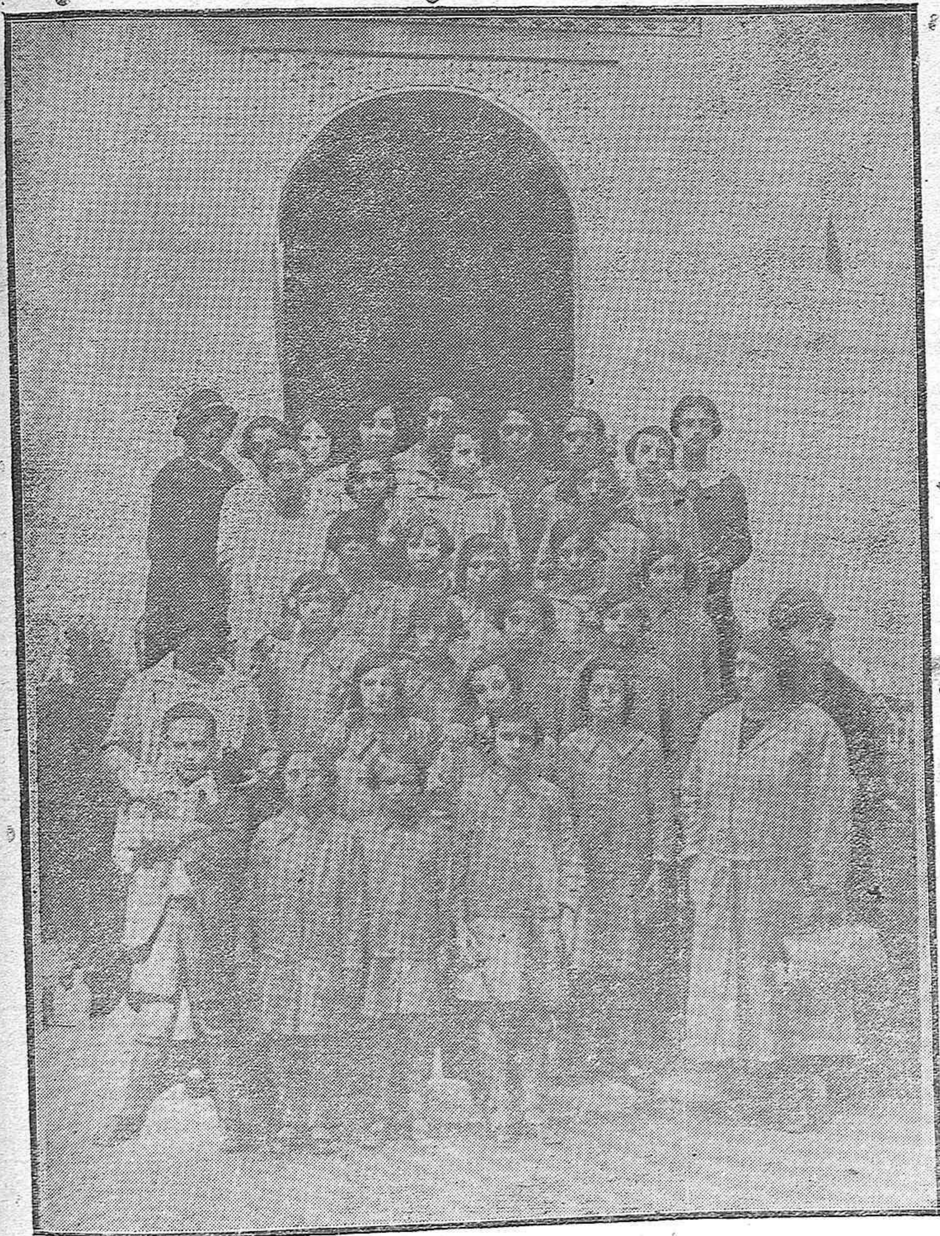
EXCURSION ESCOLAR.—Grupo de niñas de la Escuela Nacional de Villanueva de Córdoba, que han sido subvencionadas por aquel Municipio y que han llegado esta mañana a nuestra capital en visita de estudio.