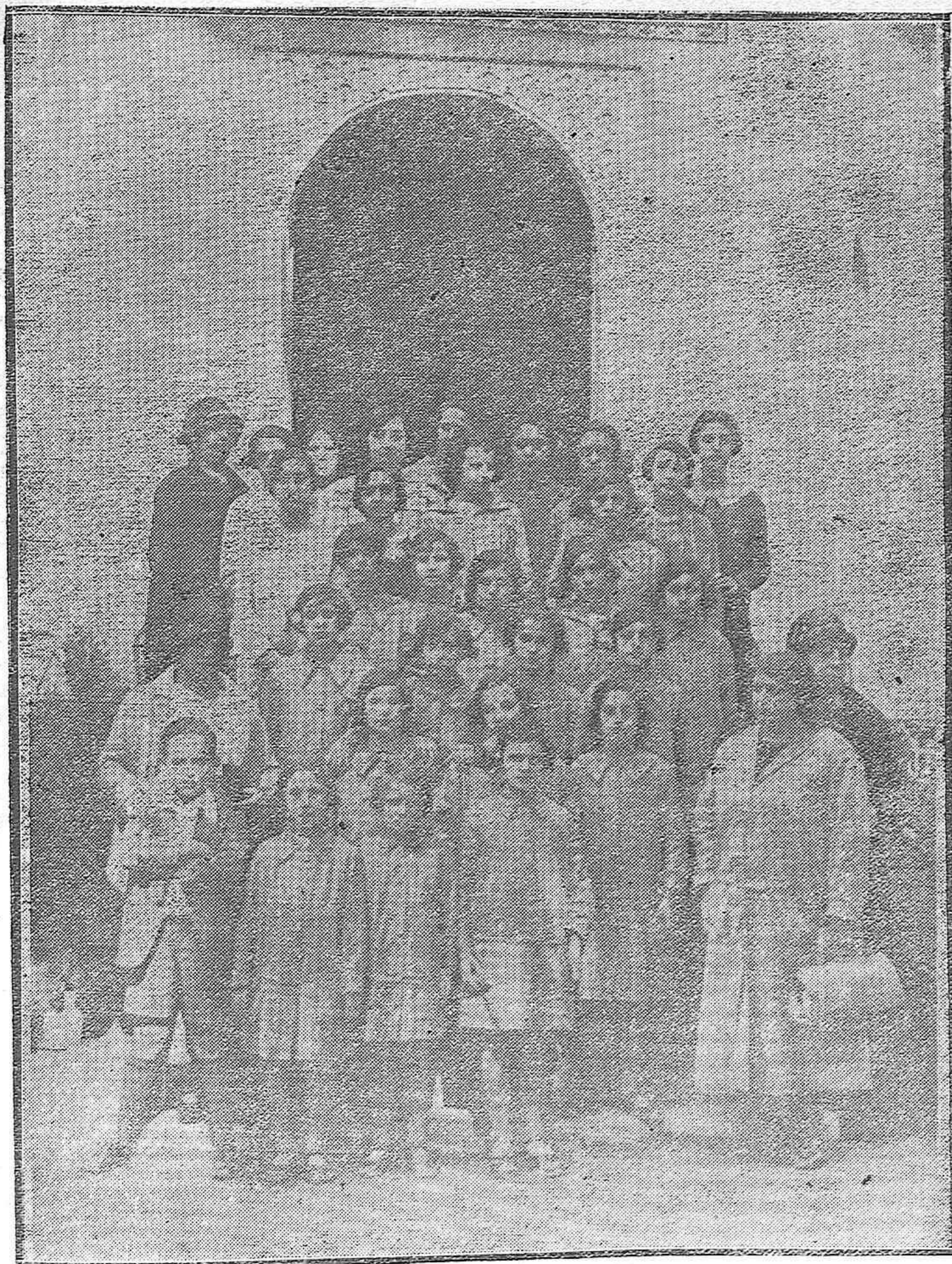
EXCURSIÓN ESCOLAR.—Grupo de niñas de la Escuela Nacional de Villanueva de Córdoba, que han sido subvencionadas por aquel Municipio y que han llegado esta mañana a nuestra capital en visita de estudio.