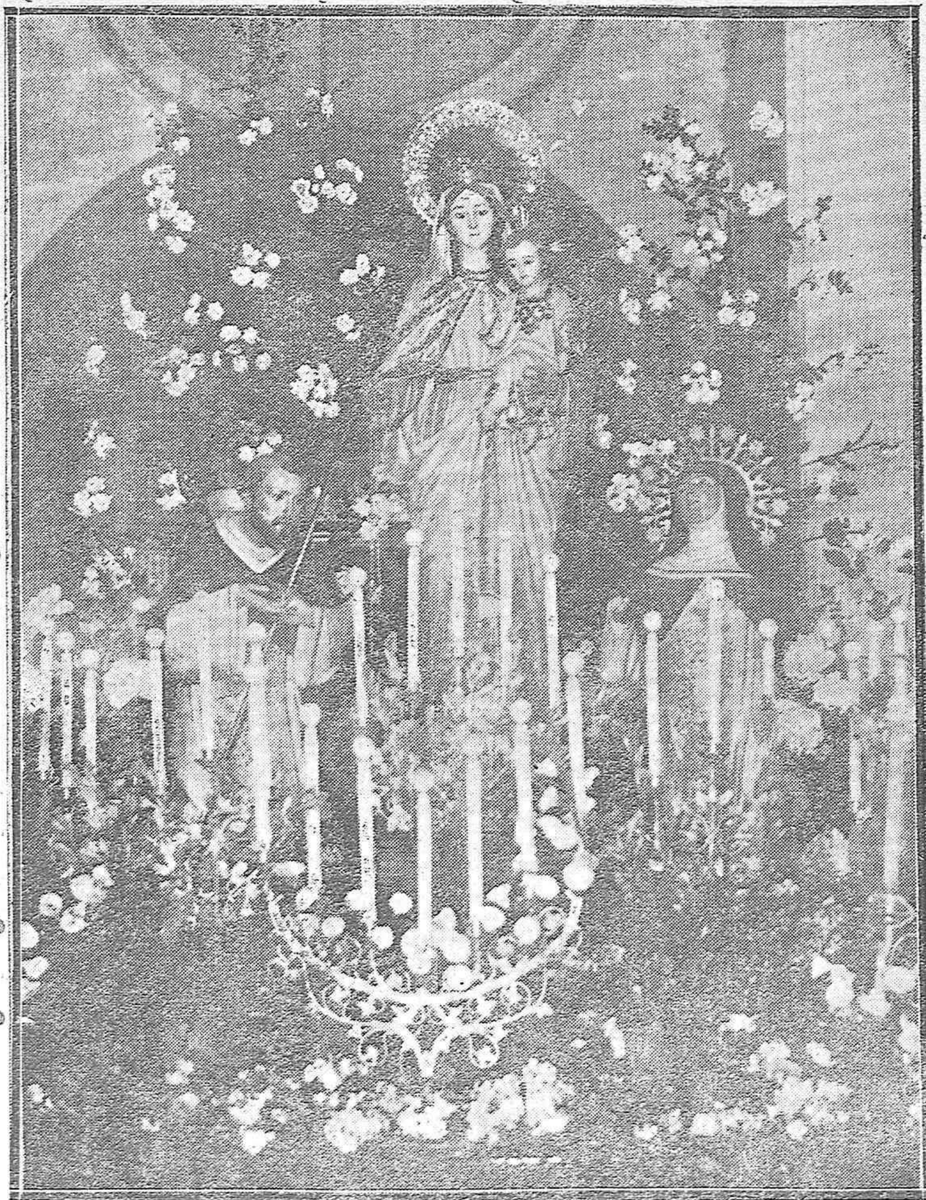
La sagrada imagen de Nuestra Señora del Rosario, llamada también de las Victorias, que fué sacada procesionalmente ayer del convento de San Agustín, donde se venera.