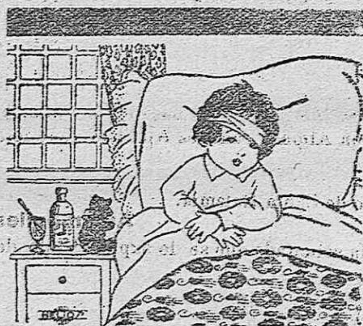
Manolito está en cama. ¿Qué tendrá Manolito?