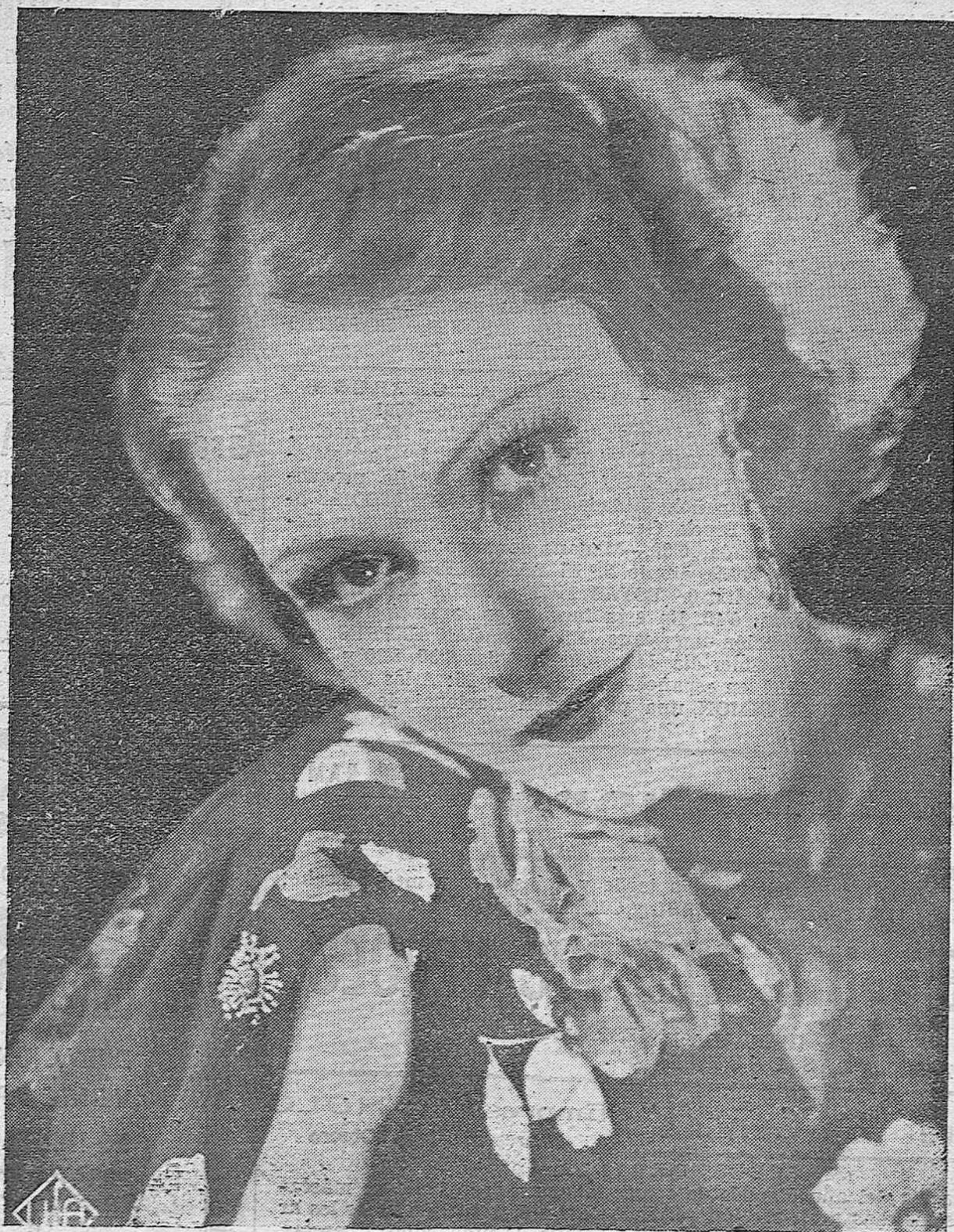
La bellissima actriz cinematográfica de la "Ufa" Brigitte Horney.