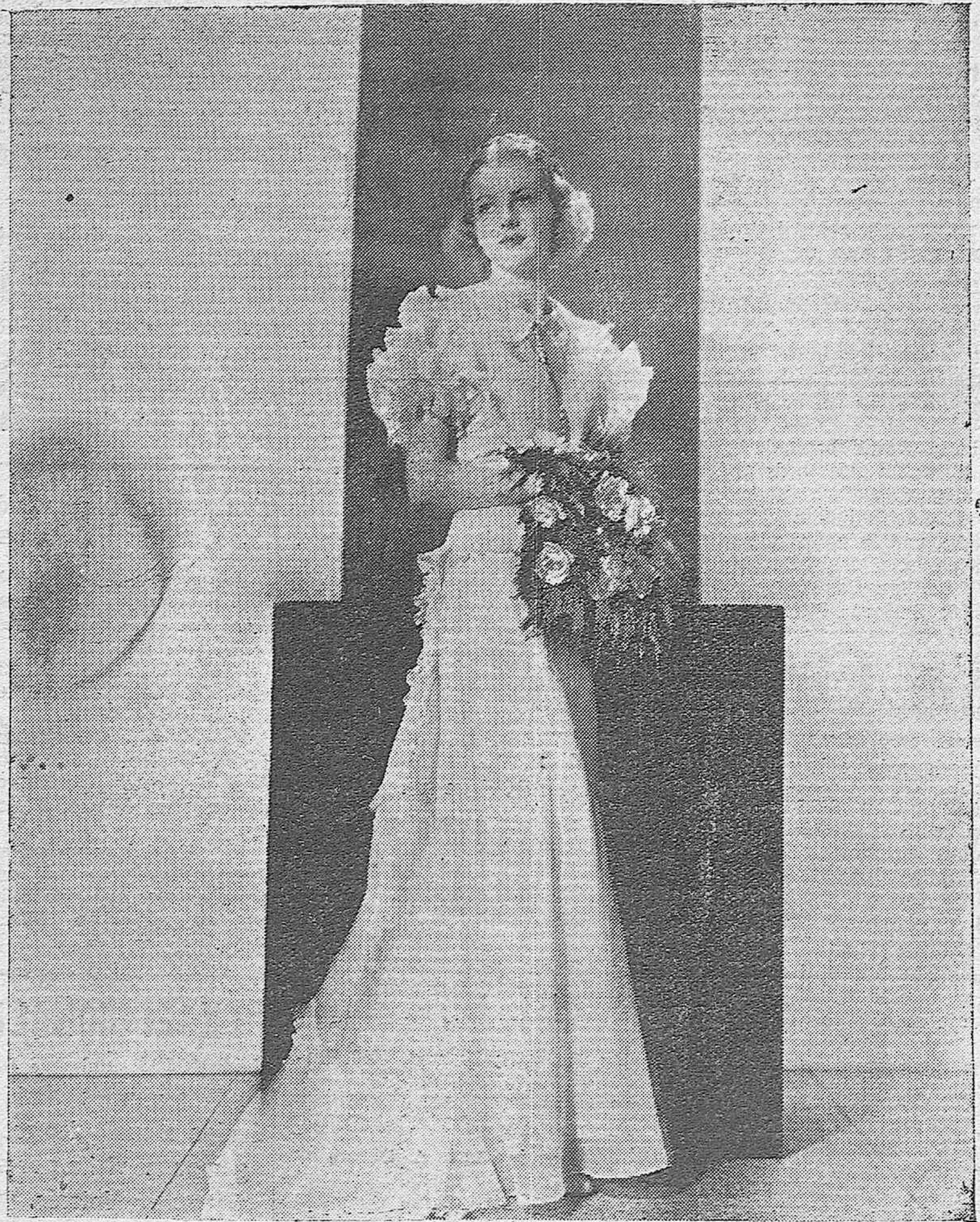
La bellísima artista de la Metro Goldwyn Mayer, Betty Furness, feliz intérprete de numerosas películas, y uno de los valores más destacados del mundo cinematográfico.