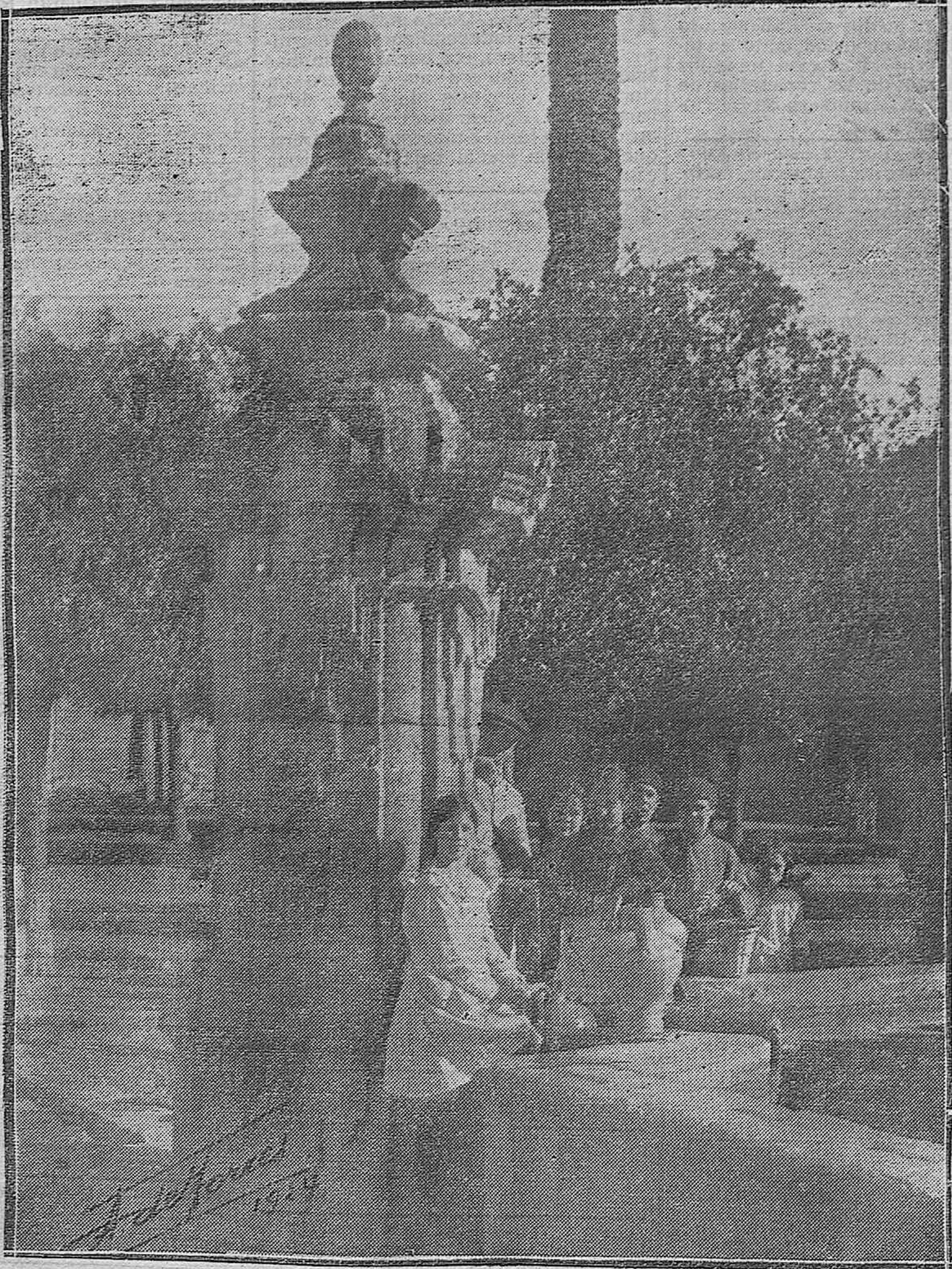
LUGARES PINTORESCOS DE CÓRDOBA.—EL CAÑITO DEL OLIVO DE LA FUENTE DEL PATIO DE LOS NARANJOS