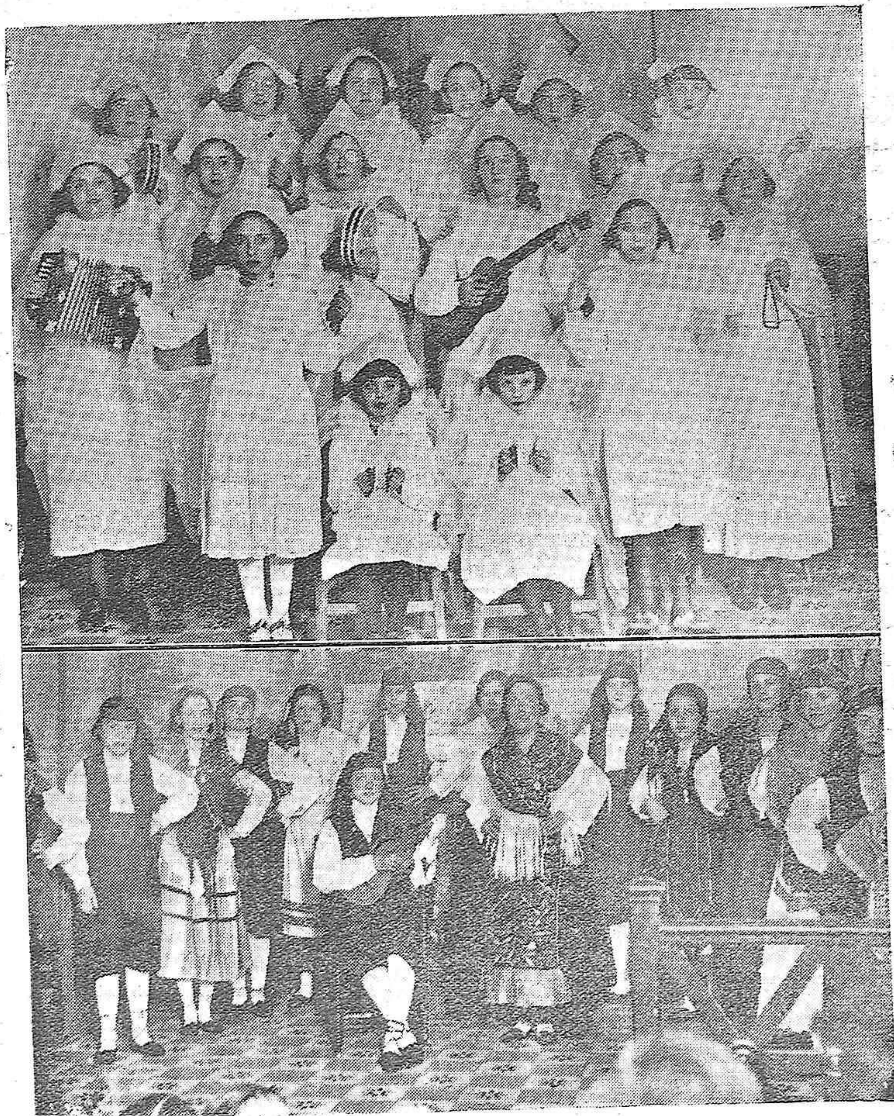
En el Colegio de la Piedad se ha celebrado un festival teatral-literario. En él intervinieron bellas muchachas. Al final se hizo una colecta entre las personas que asistieron para adquirir ropas que han de repartirse a los pobres, en las próximas fiestas de Navidad.