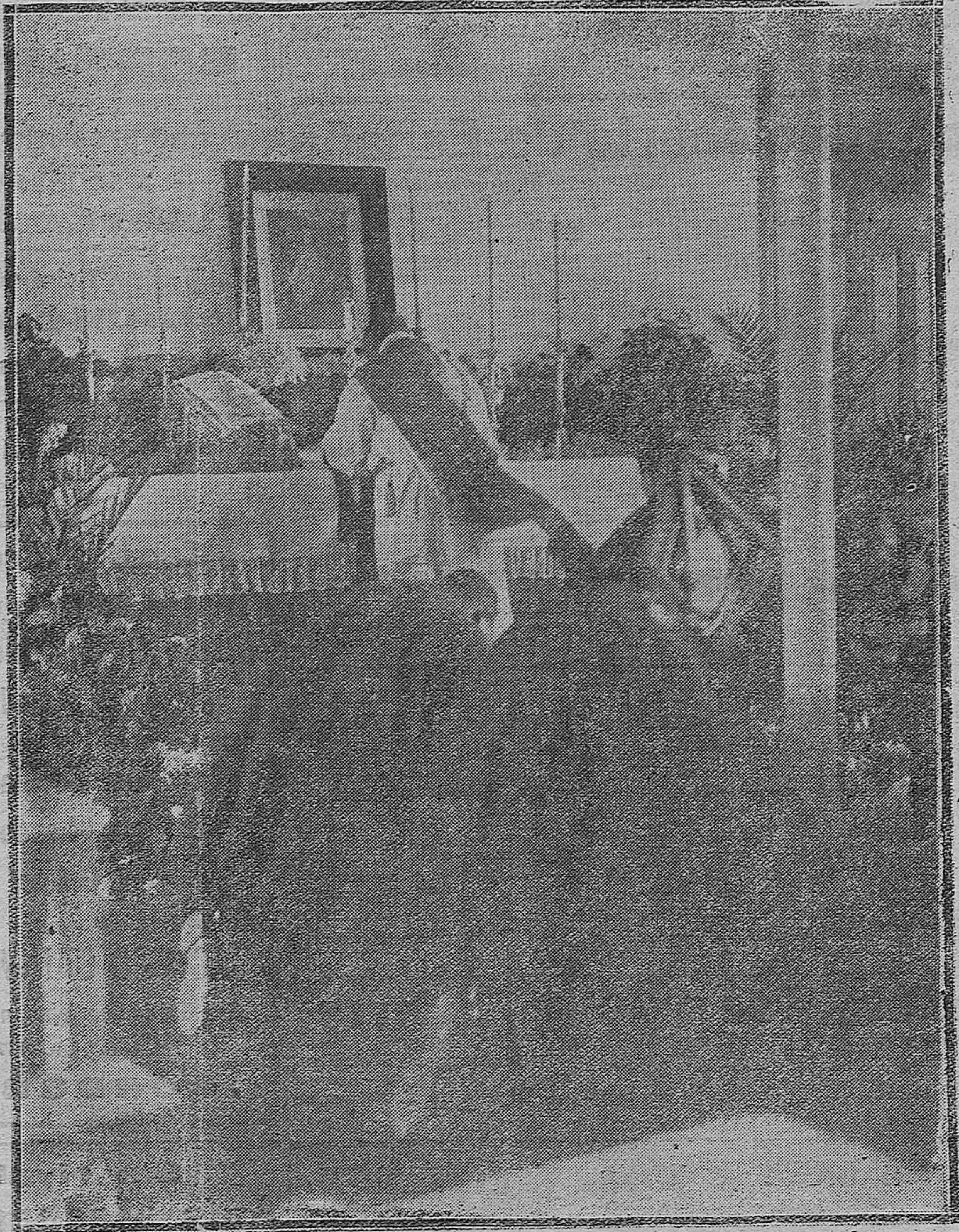
LA FIESTA DE SANTA BARBARA.-Momento de aizar en la misa celebrada en el Cuartel de Artillería.