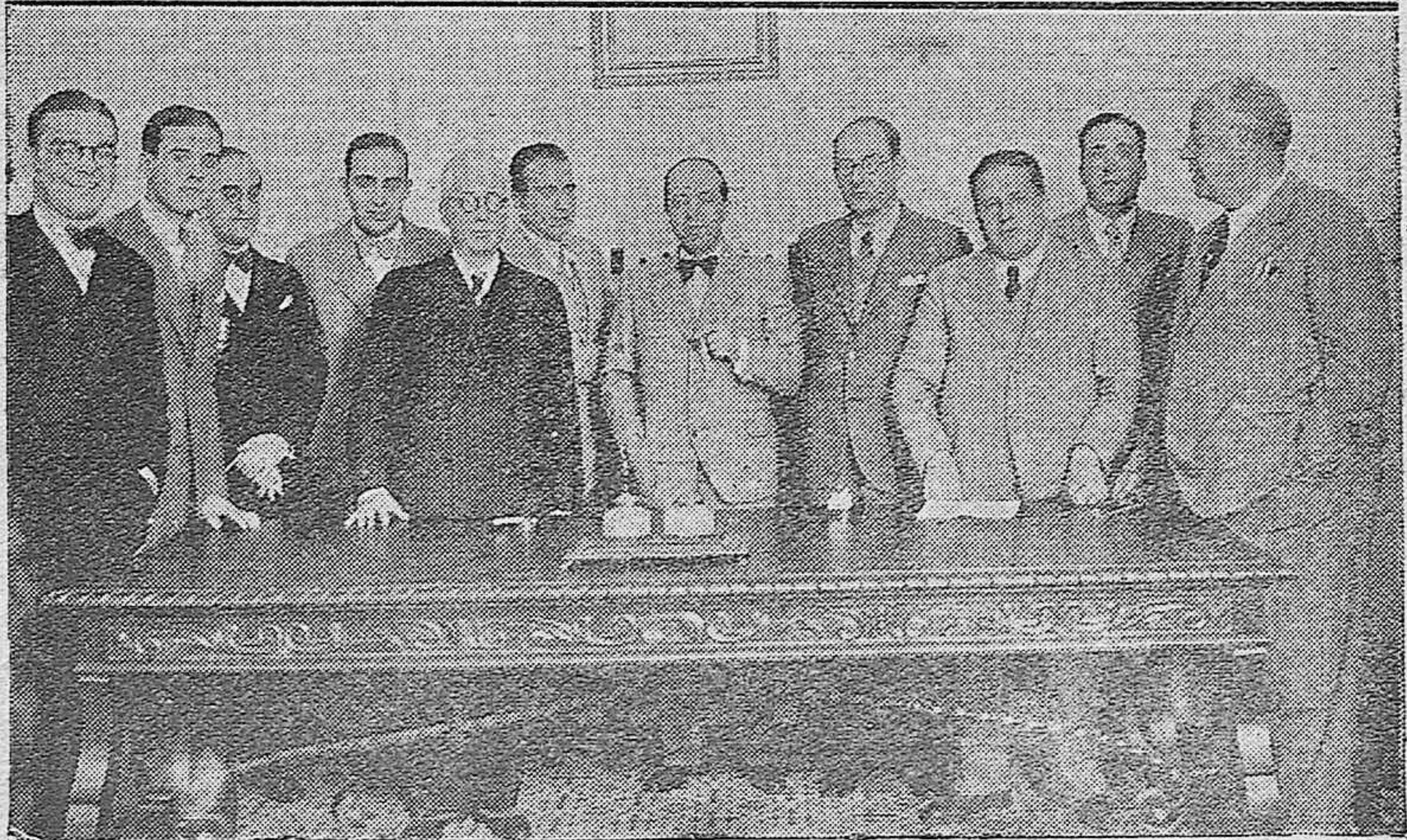
En las Academias de Ciencias, Nobles Artes y Bellas Letras, y en la de Ciencias Médicas, se inauguró solemnemente el curso de Conferencias para 1935-1936.—Presidencias de los dos actos.