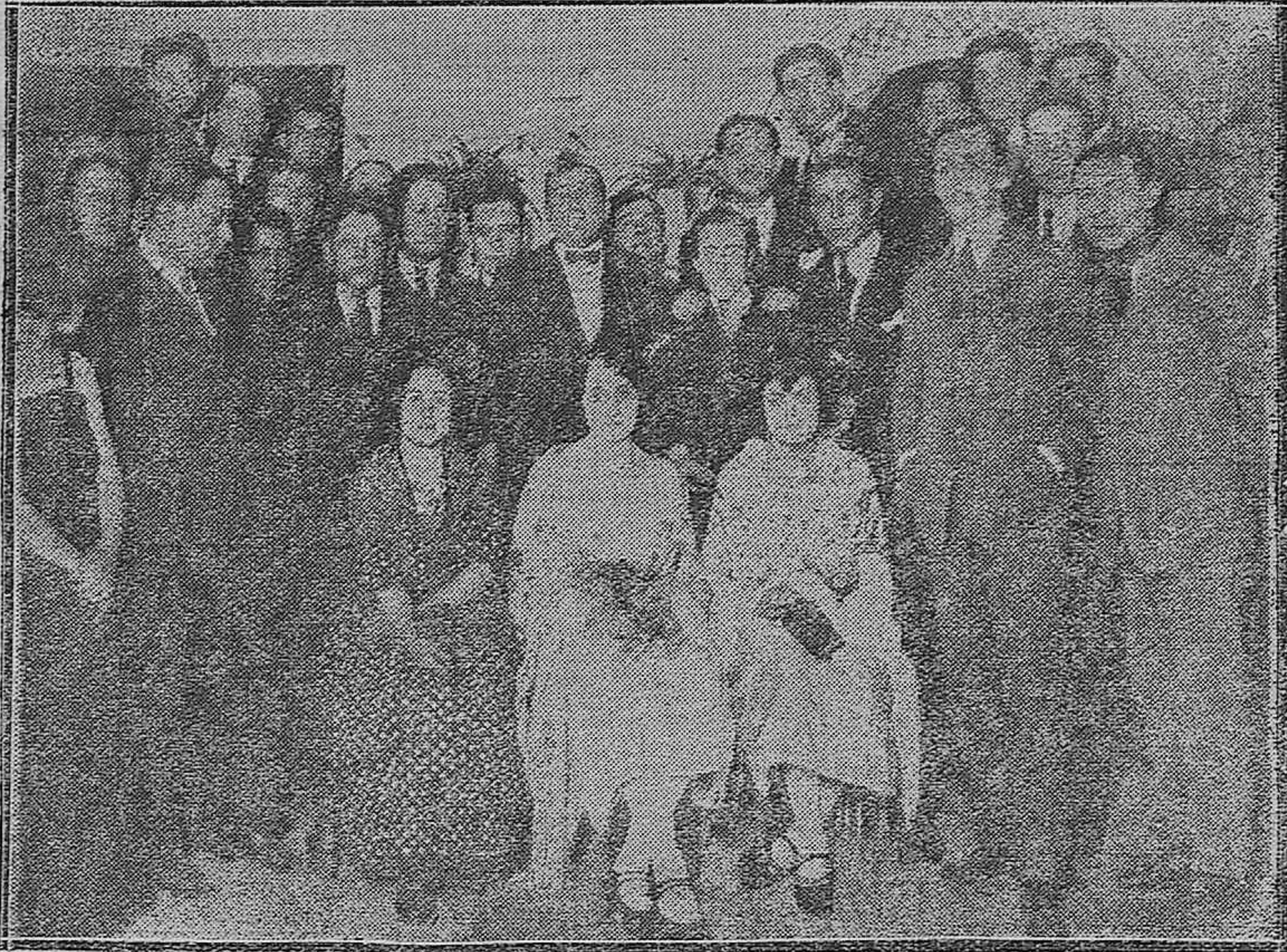
Grupo de concurrentes a la verbena popular organizada por la Sociedad Filarmónica Rublo.—Las tres jóvenes premiadas rodeadas del jurado y directiva de la sociedad.