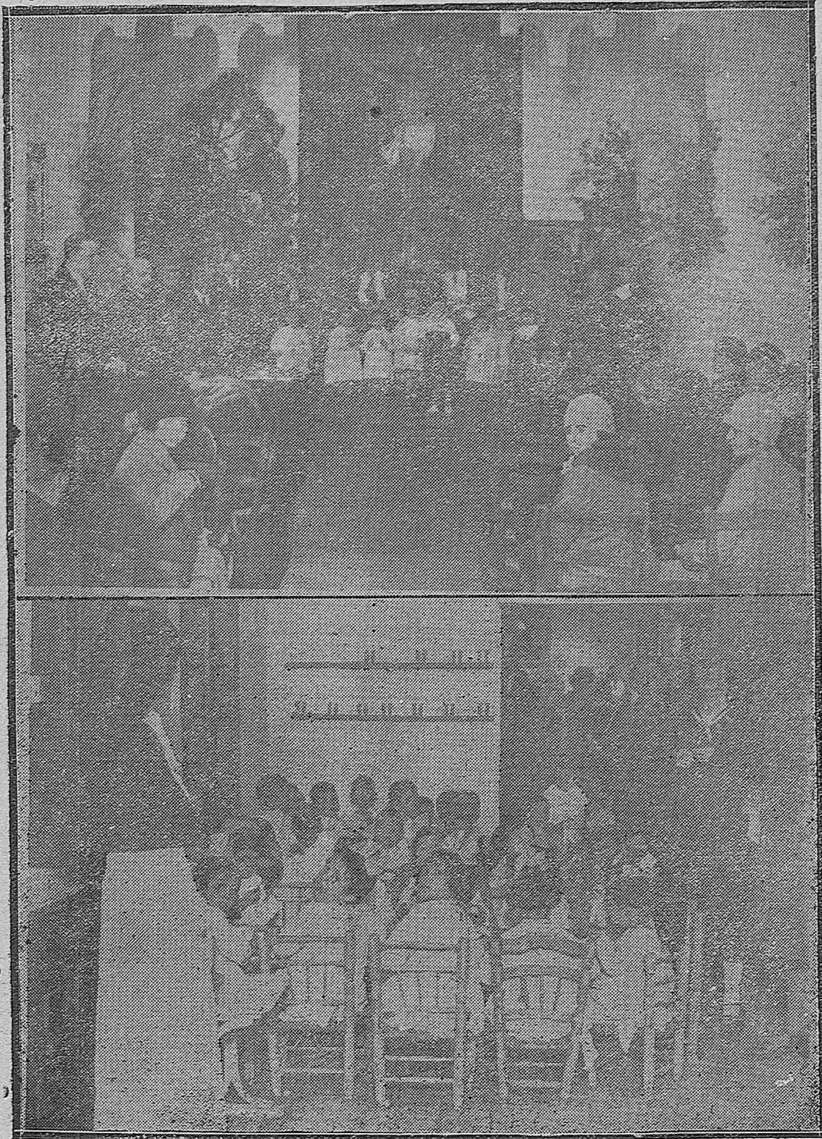
EN LA CASA DEL NIÑO.--1) Momento del reparto de prendas y juguetes a los niños, a presencia de las autoridades.--2) Los acogidos, durante la merienda con que fueron obsequiados.