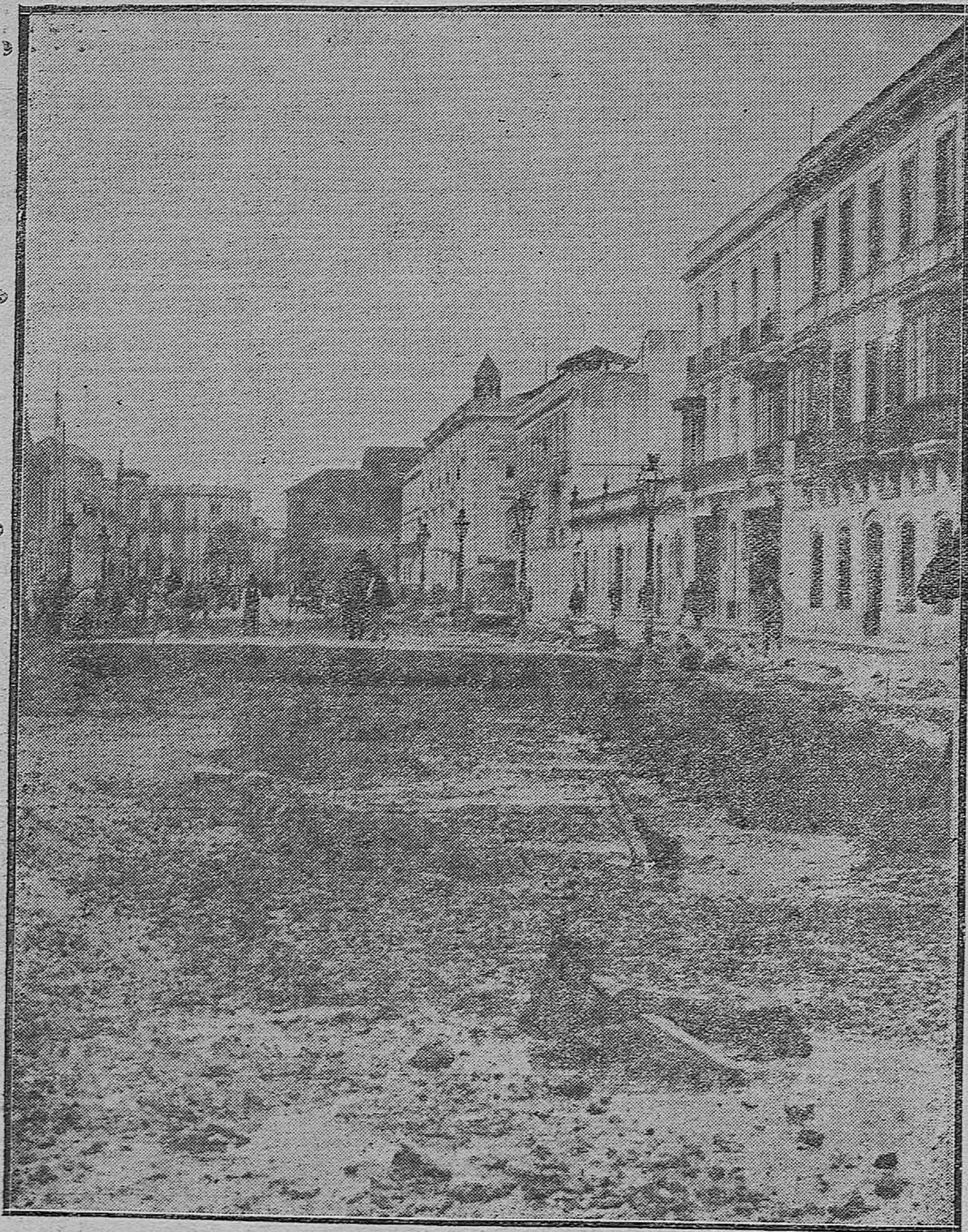
LAS REFORMAS DE CÓRDOBA.- Actual aspecto que ofrece el paseo del Gran Capitán, en el que con gran actividad se realizan las obras para convertirlo en moderno boulevard.