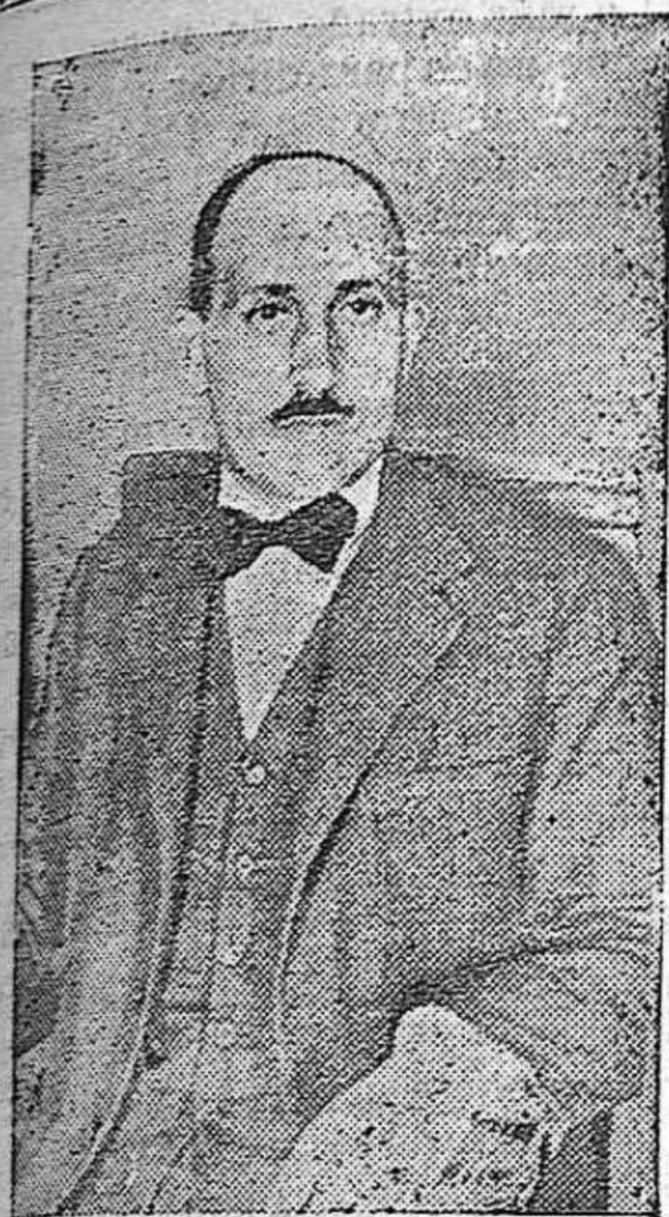
EL DIGNO JUEZ DE INSTRUCCION DEL DISTRITO DE LA IZQUIERDA DON EDUARDO IGLESIAS PORTAL, QUE CON CELO EXTRAORDINARIO INSTRUYE LAS DILIGENCIAS EN EL SUMARIO POR EL DOBLE ASESINATO DE LOS AMBULANTES DE COPREOS.