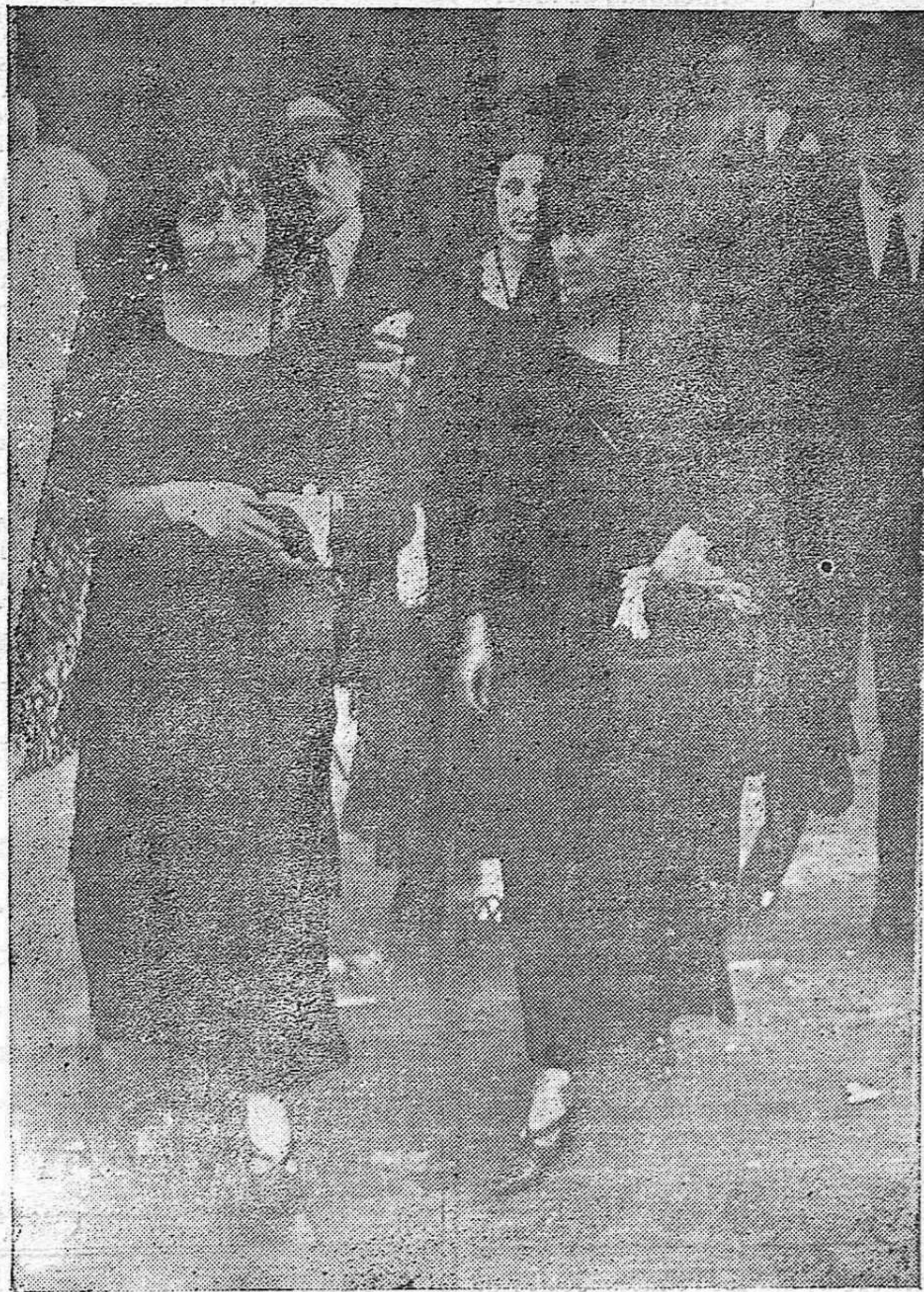
DAMAS DE LA ARISTOCRACIA CORDOBESA, A SU SALIDA DE LA CATEDRAL EN LA TARDE DEL JUEVES SANTO.

Lo que se hace público para general conocimiento de los contribuyentes interesados; notificándoles al mismo tiempo, que el periodo voluntario para satisfacer sus cuotas sin recargo, termina el día 15 de Mayo próximo.