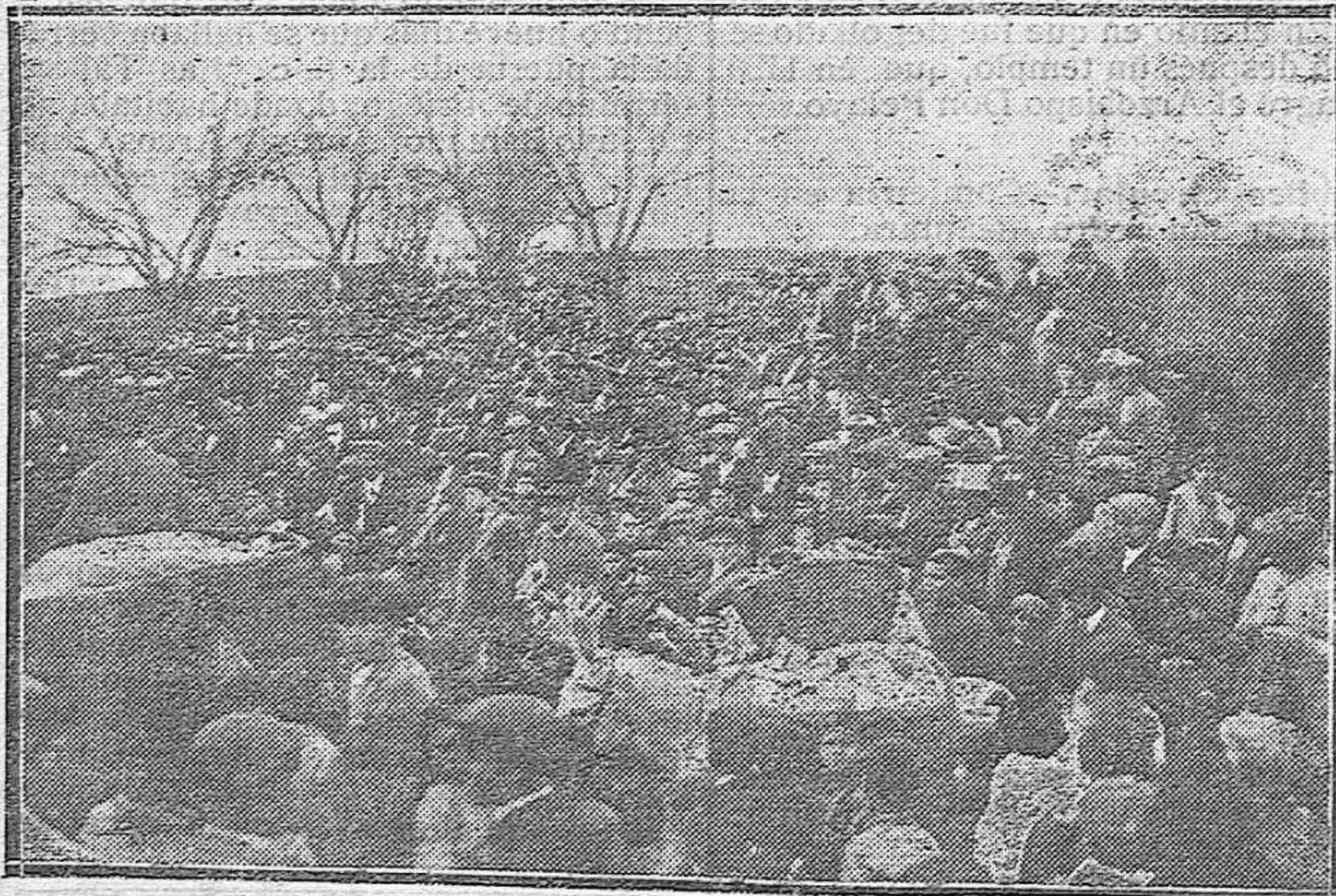
LA RAMBLA.—LA FIESTA DEL ARBOL, CELEBRADA ESTE AÑO POR PRIMERA VEZ Y A LA QUE CONCURRIERON TODOS LOS NIÑOS PERTENECIENTES A LAS DISTINTAS ESCUELAS MUNICIPALES DE LA CIUDAD.