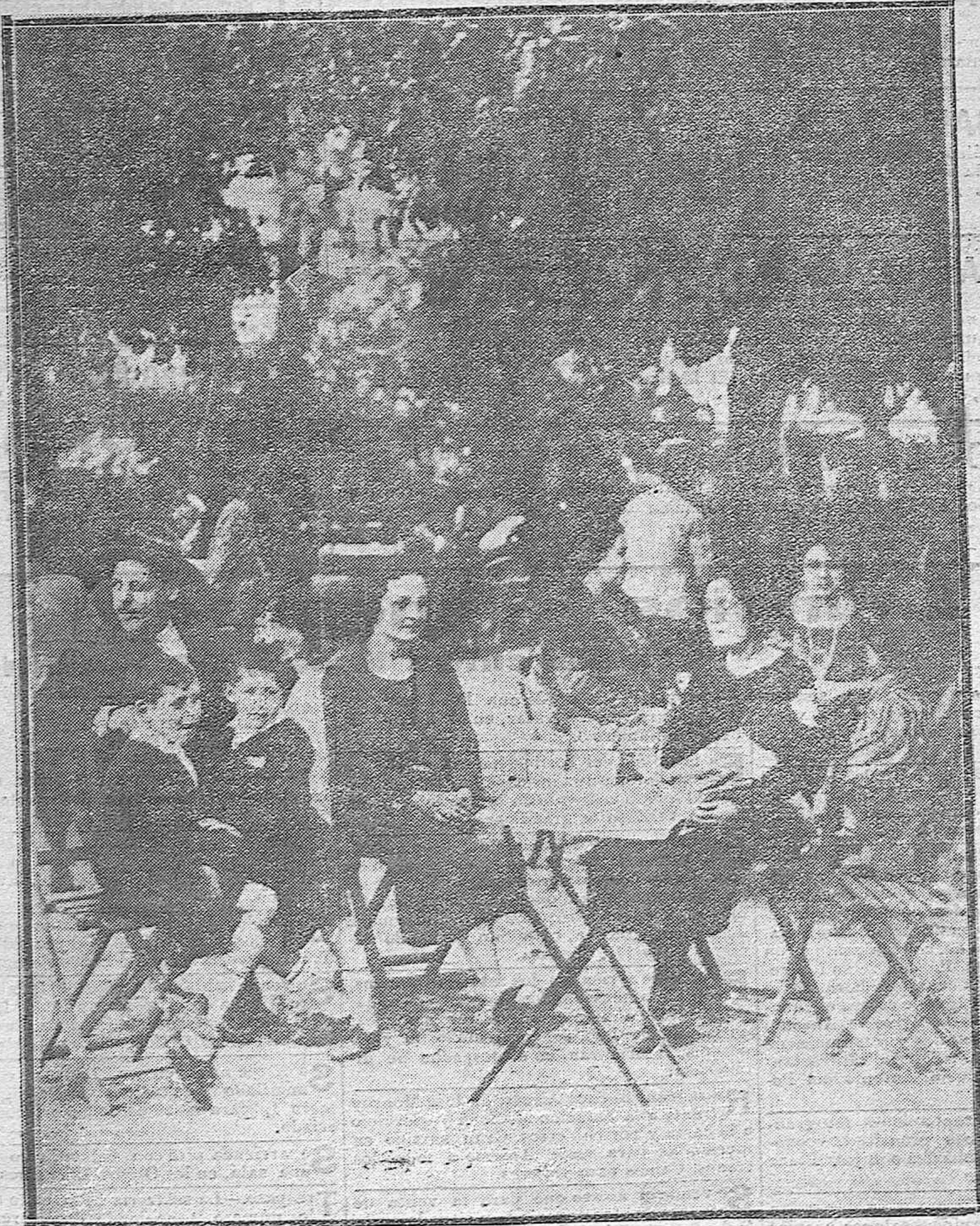
EL VERANEO EN CÓRDOBA.--Los que van a buscar una temperatura agradable a los Jardines de la Agricultura.