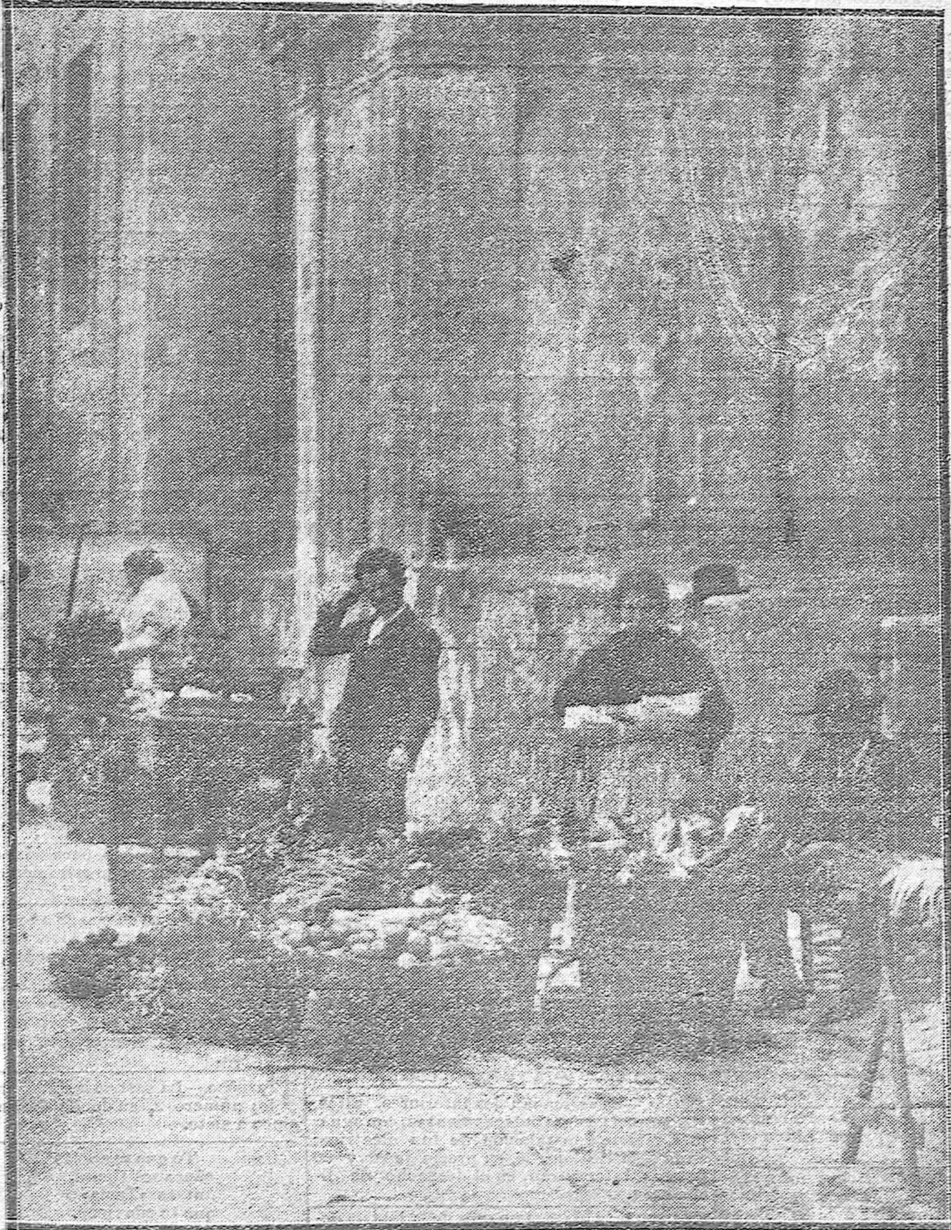
LOS TIPICOS MERCADOS CORDOBESES.--Un puesto de verduras en la Judería