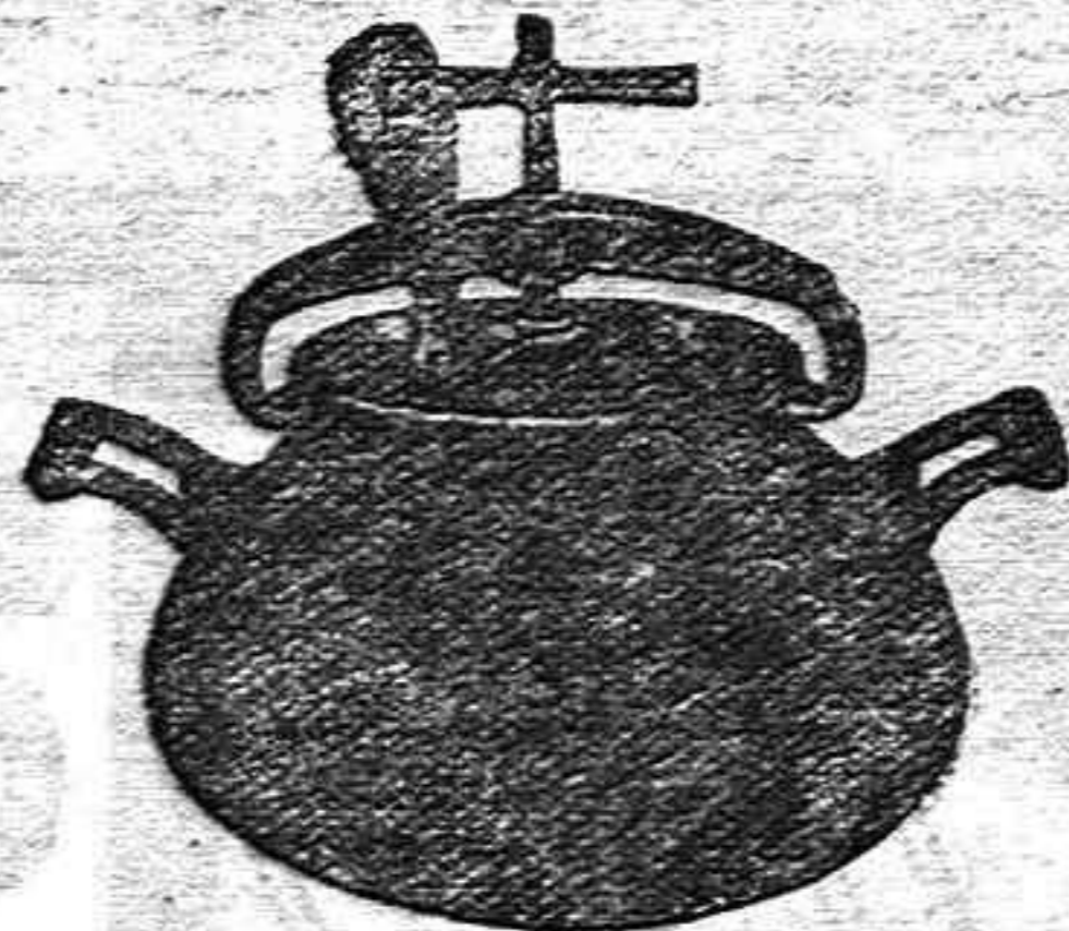
Marmita Hispano-Olla Exprés.

Batería de cocina - Herrajes para obras y herramientas en general