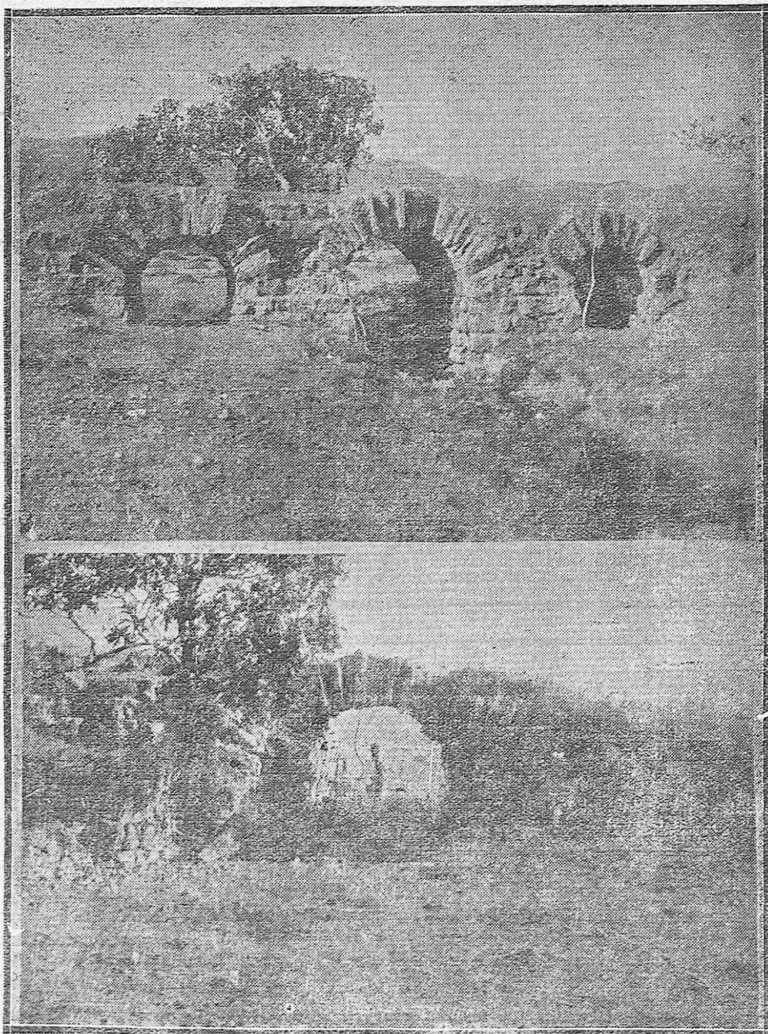
DE LA CORDOBA ARQUEOLOGICA.—PUENTES ARABES EN EL CAMINO DE MEDINA-AZAHARA.