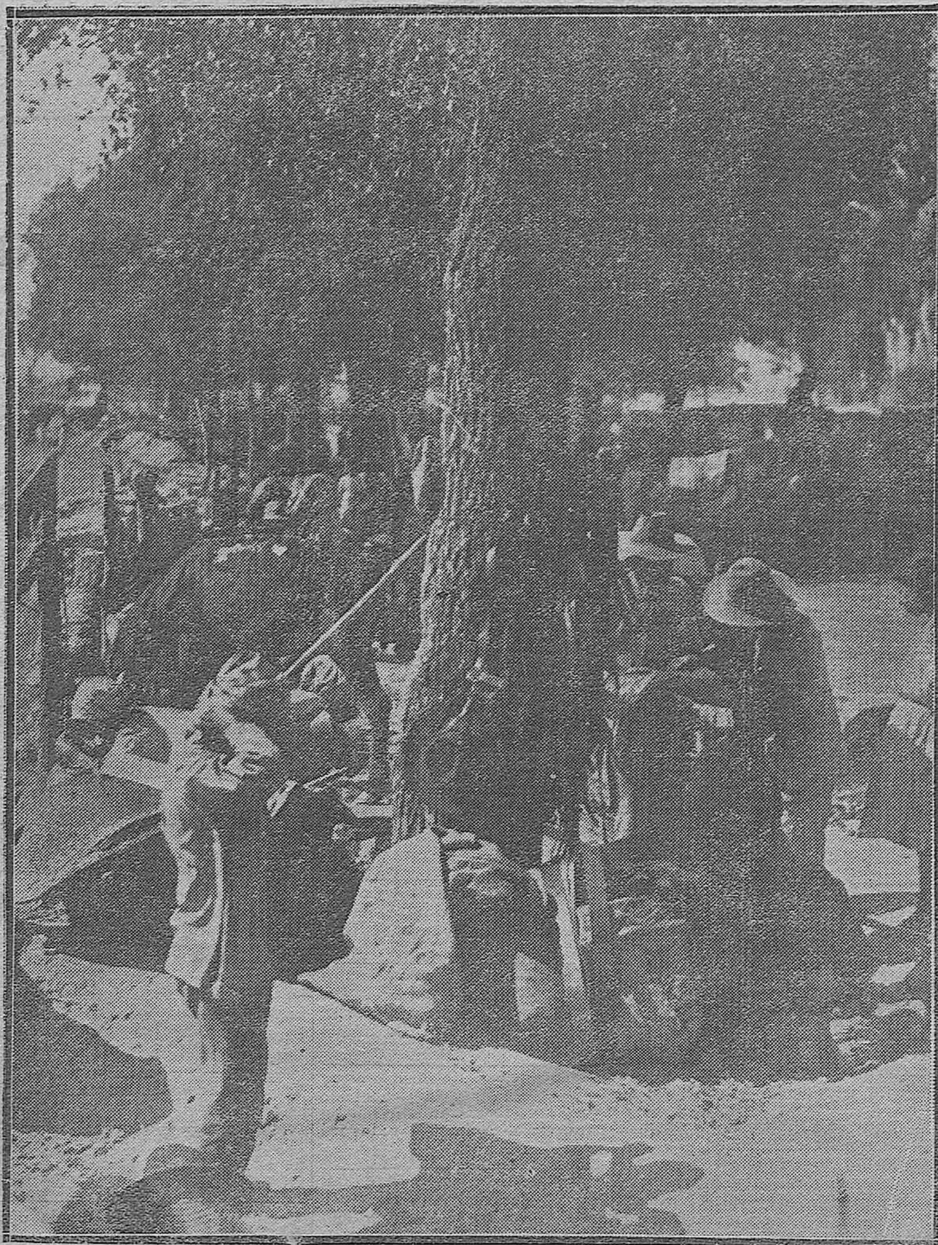
EPILOGO DE FERIA.--Un modesto vendedor de jaquimas y arreos, ejerce su comercio al pie de un frondoso árbol en el corazón del mercado de ganados.