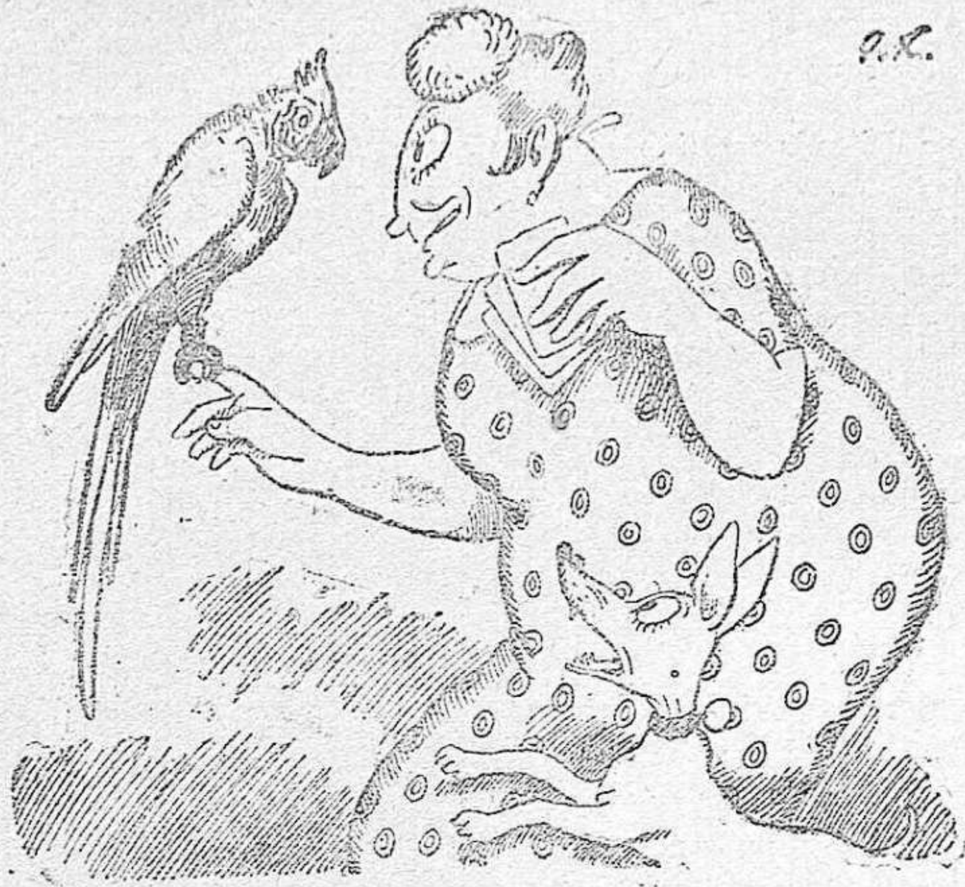
DOÑA COLORINA... «A su guacamayo con alegría le cambia los colores cada ocho días...» (y con tintes Wiki)

Y el guacamayo le está agradecido. No hay más que verle la cara para comprenderlo. Al lado del brillo y la viveza de los colores del tinte Wiki, los suyos naturales no tenían mérito. Por eso se pasa el día repitiendo: los mejores tintes domésticos los tintes Wiki. Pida usted un sobre en cualquier Droguería; pero no se deje engañar, que sean Wiki, Wiki. Cada sobre lleva la manera de usar su contenido.