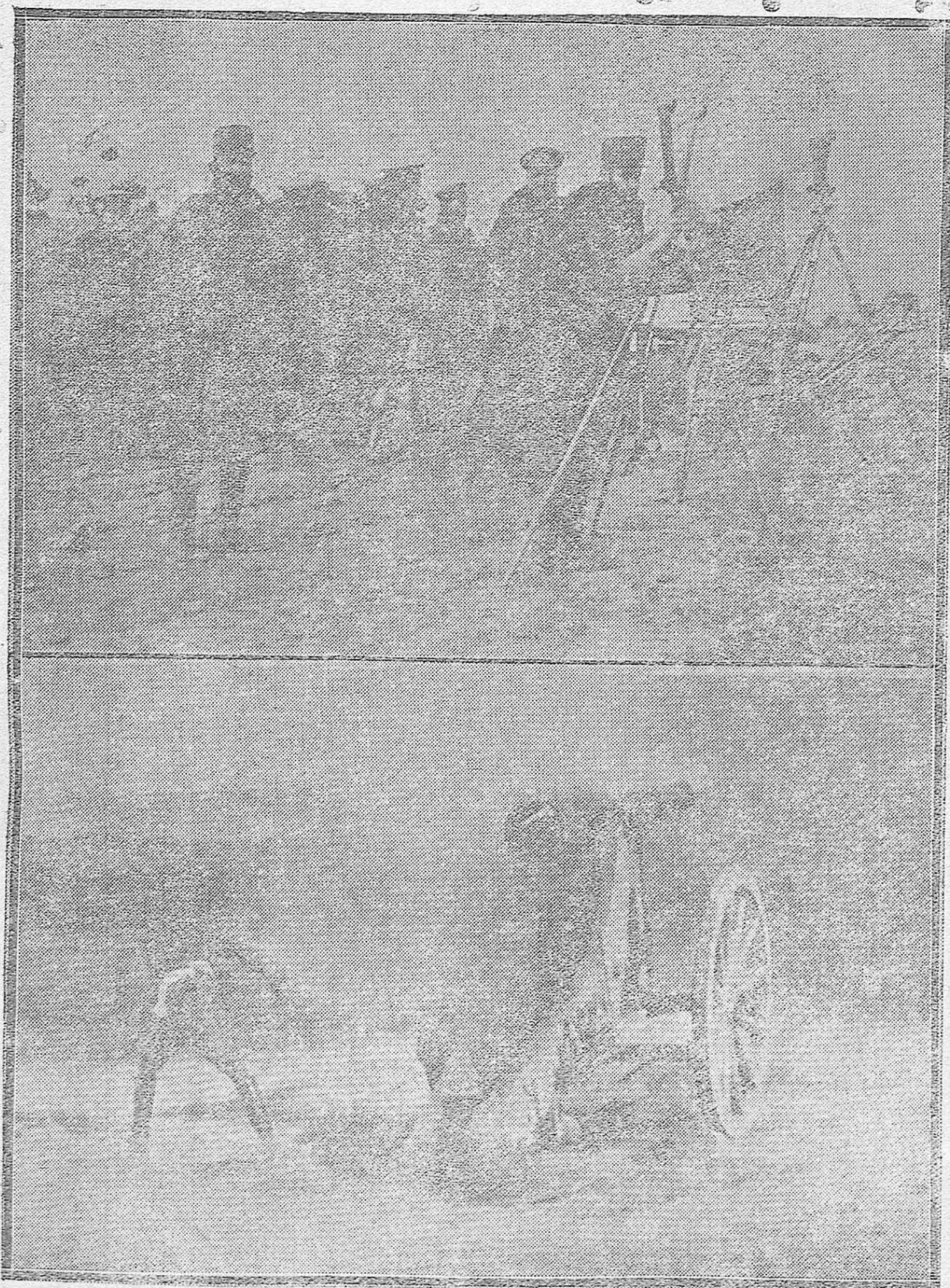
LAS PRÁCTICAS DEL 4.º PESADO DE ARTILLERÍA.--1) El puesto de mando observando los corteros efectos de los disparos.--2) Una pieza de 12 centímetros en el momento de disparar.