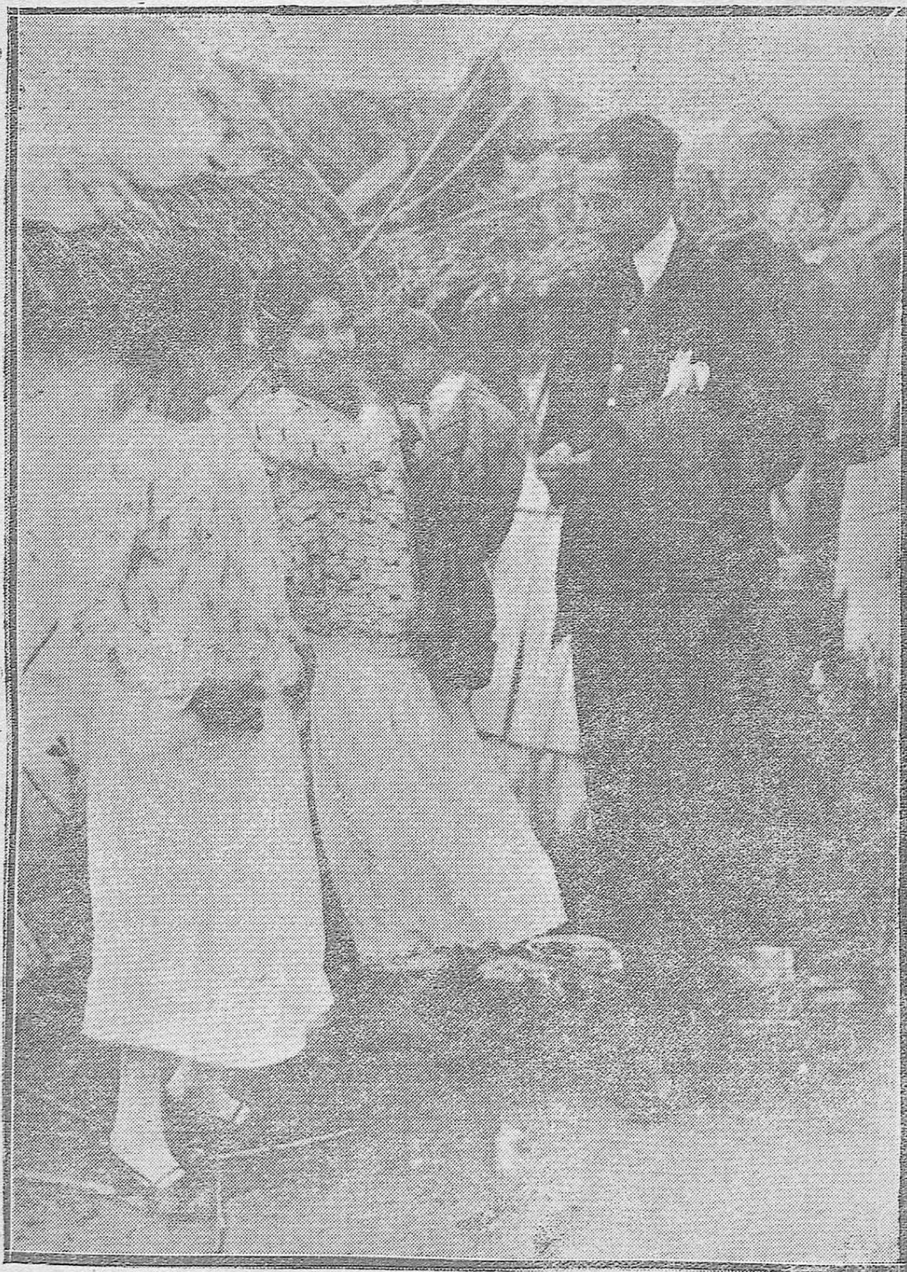
"EL BARRIO DE LA MISERIA".--Dos bellas indigenas facilitando a uno de nuestros redactores varios datos acerca de cómo se vive en los chozos del Campo de la Verdad.