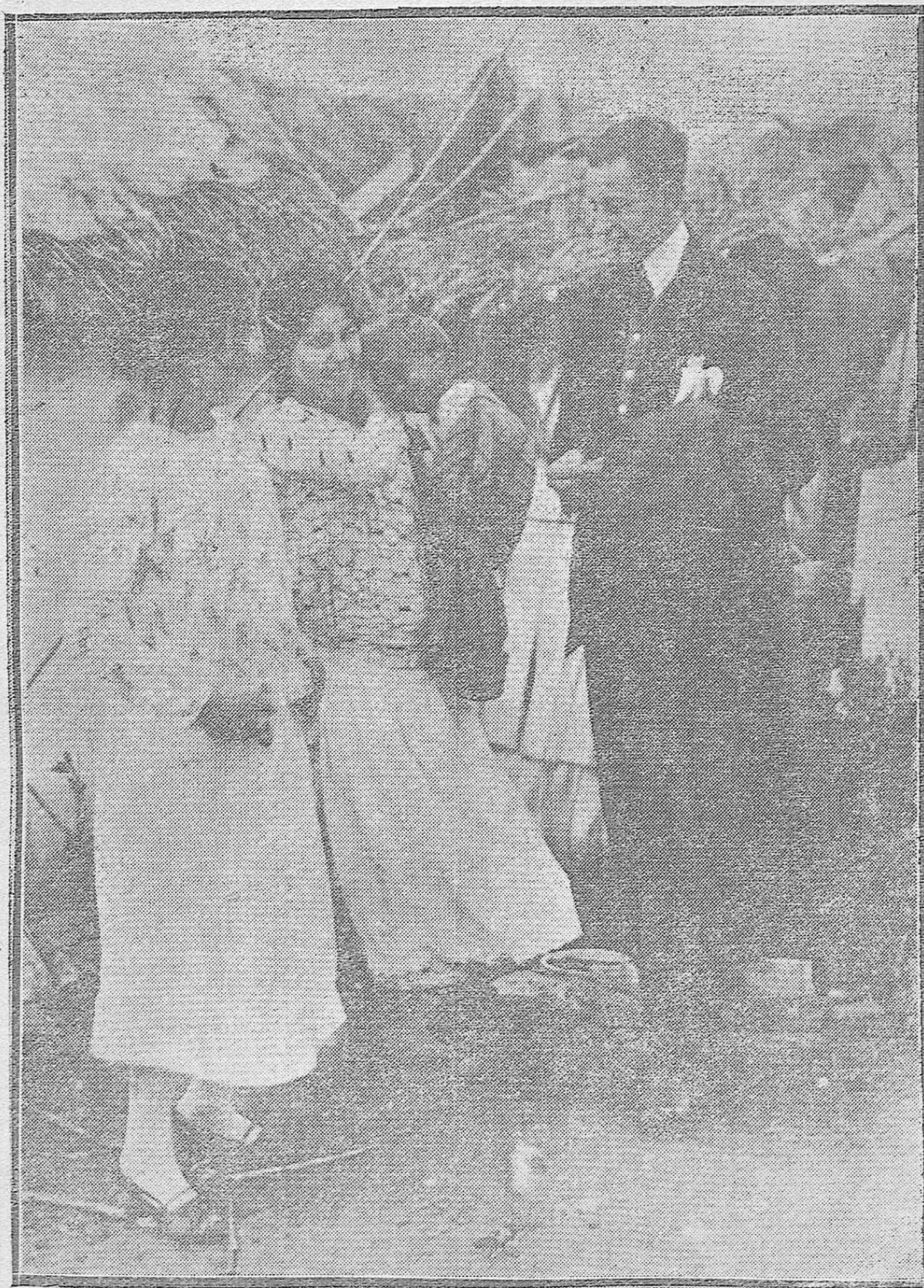
"EL BARRIO DE LA MISERIA".--Dos bellas Indígenas facilitando a uno de nuestros redactores varios datos acerca de cómo se vive en los chozos del Campo de la Verdad.