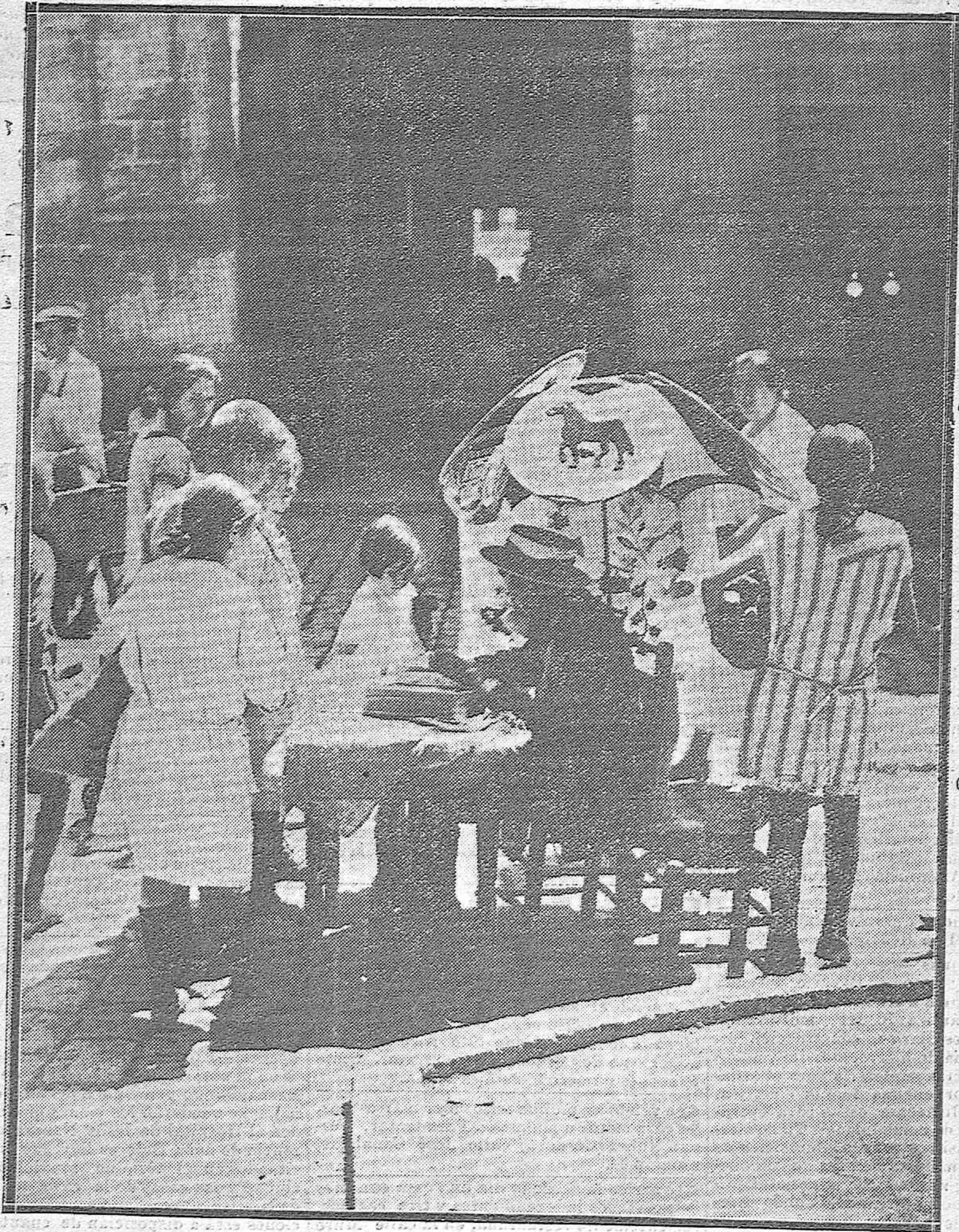
ESCENAS POPULARES CORDOBESAS.-- Bordador de tapices turcos demostrando su arte ante un grupo de curiosos en la Corredera.