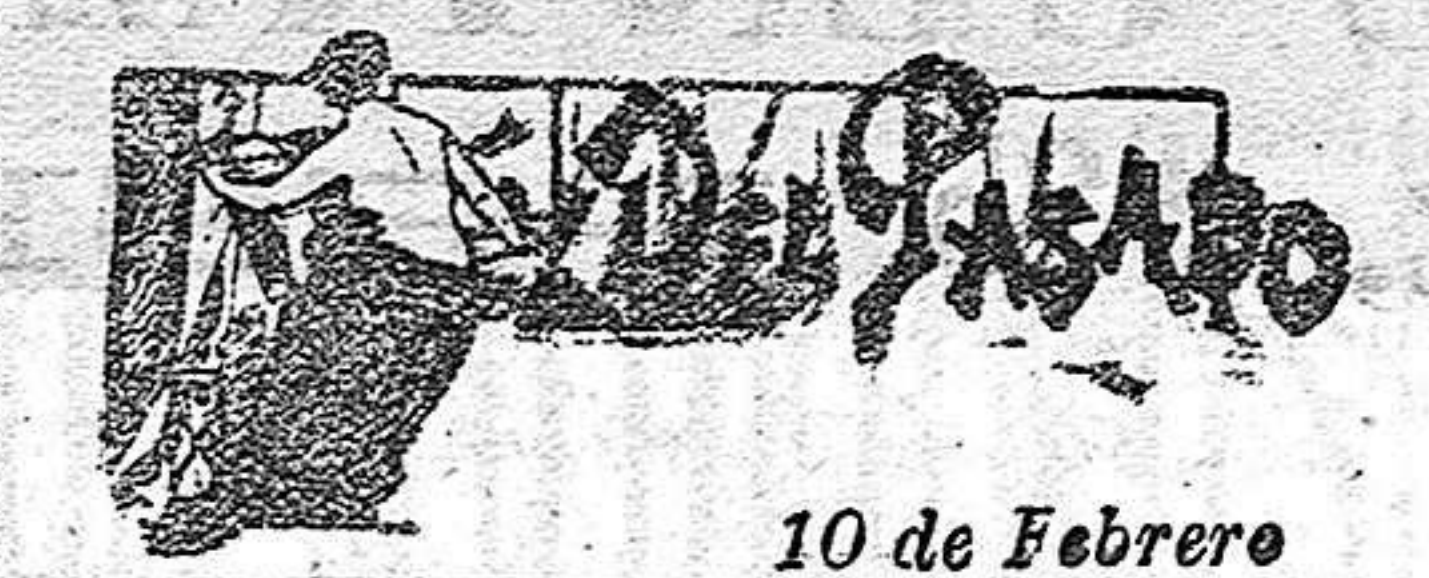
10 de Febrero

¡Lástima que el público se muestra refractario á la ópera, y no acuda en tropel, como debiera, á premiar la labor de los artistas que bajo los auspicios de la Fons, interpretan lo mejor del repertorio de ópera italiana!