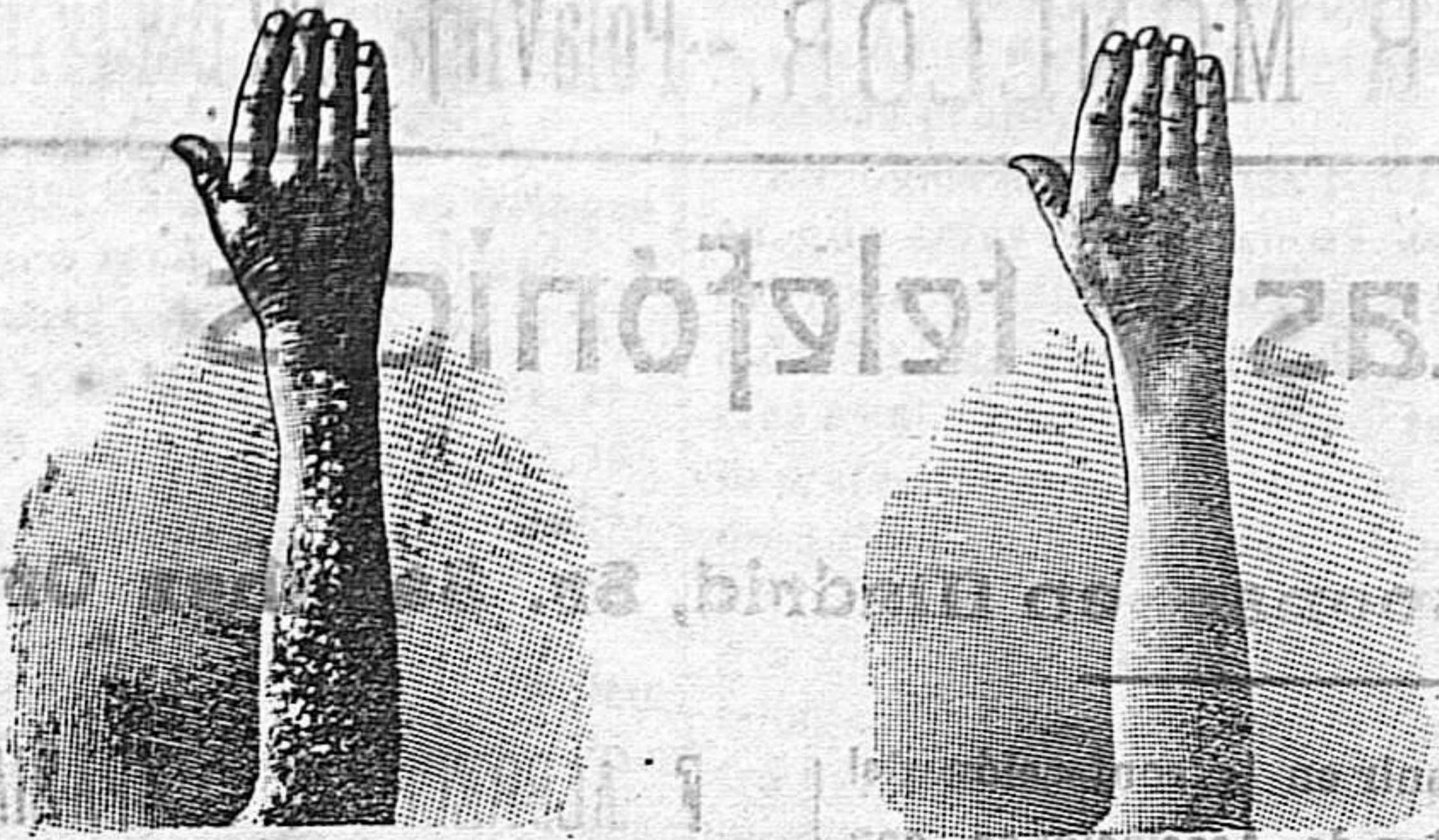
Azules de la curación