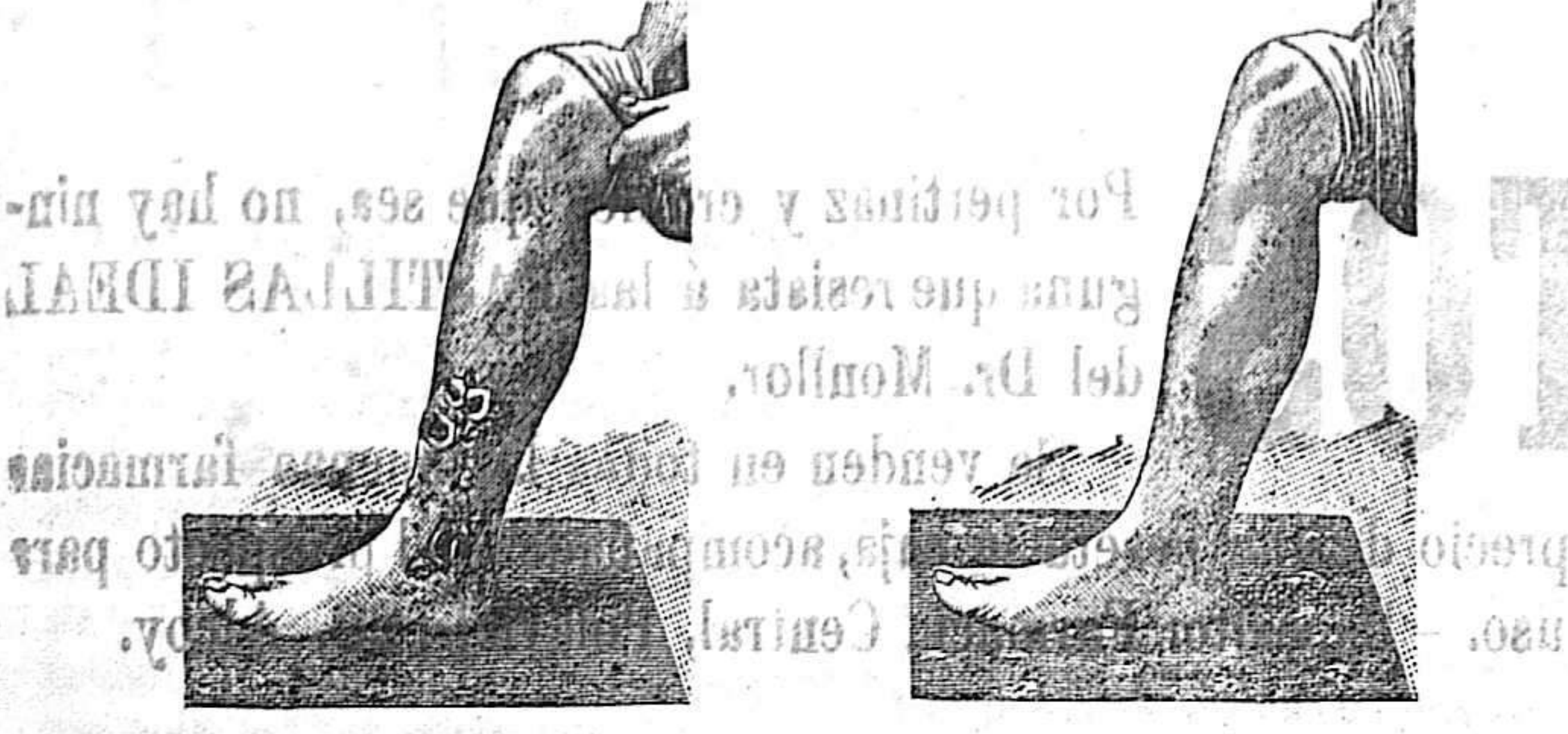
Antes de la curación Después de 15 días de tratamiento

Descubrimiento sensacional CURACIÓN DE LAS ENFERMEDADES DE LA PIEL Y TAMBIÉN DE LAS LLAGAS DE LAS PIERNAS LA PIEL MALES DE LAS PIERNAS