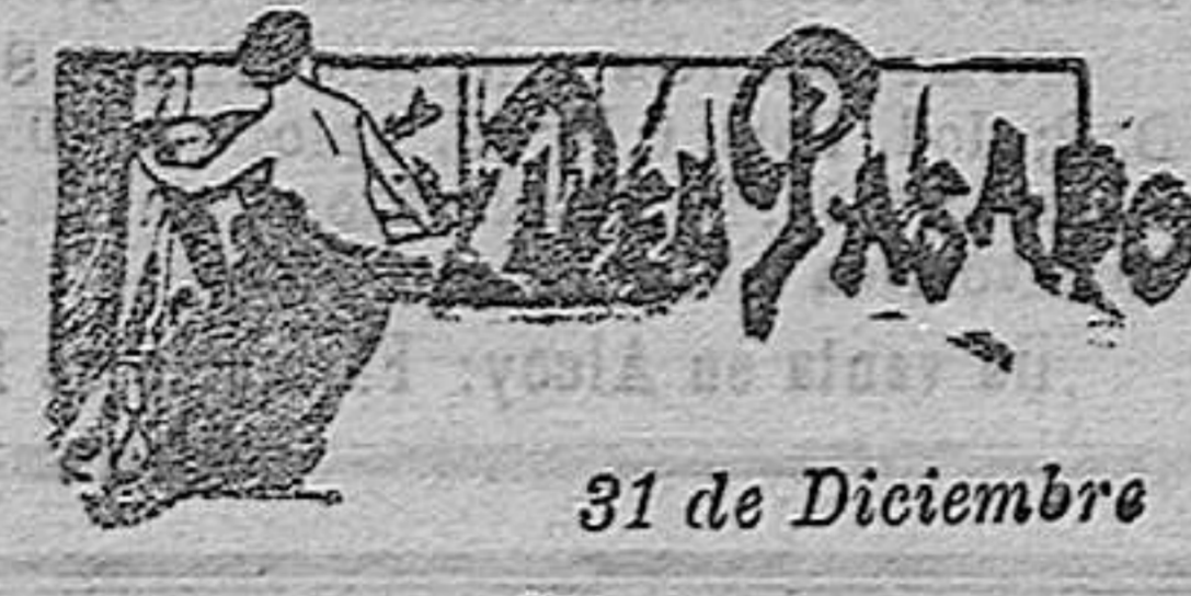
31 de Diciembre