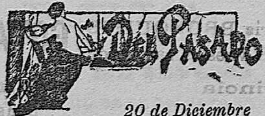
20 de Diciembre