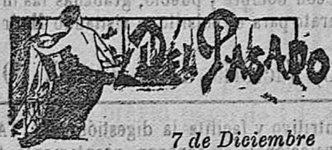
José de la Serna

muerte! Concluyamos de una vez. Ahora se verá quién es Talegón, digo ¡mil bombas!, ahora se verá quién soy yo.