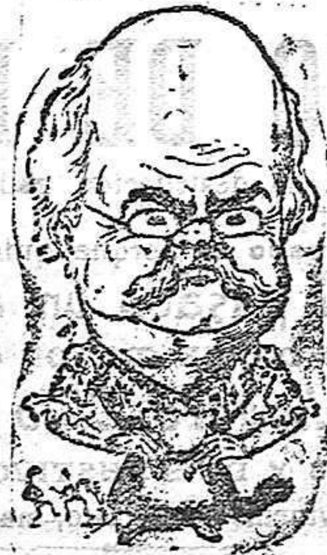
Mr. Charles Lecocq

Este célebre compositor de música nació en París en 1833, ingresando en el Conservatorio á la edad de 18 años. Hijo de un modesto empleado del Tribunal de Comercio, su inclinación natural fué la música, habiendo obtenido en el primer año de sus estudios un premio en armonía y acompañamiento; poco después alcanzó otro en la fuga y contrapunto.