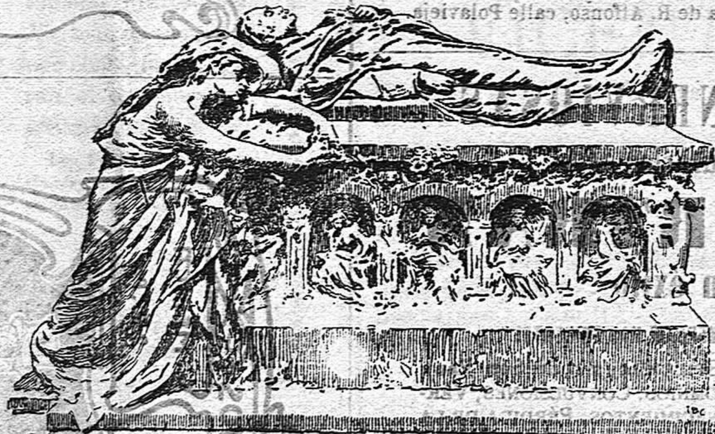
EL SEPULCRO DE CÁNOVAS

En la sección de escultura de la actual Exposición nacional, figuran dibujados los principales detalles del sepulcro de Cánovas. En él, que el mundo se fija en su sitio, echará de menos un dibujo del total, sería lo mejor para dar una idea completa del monumento.