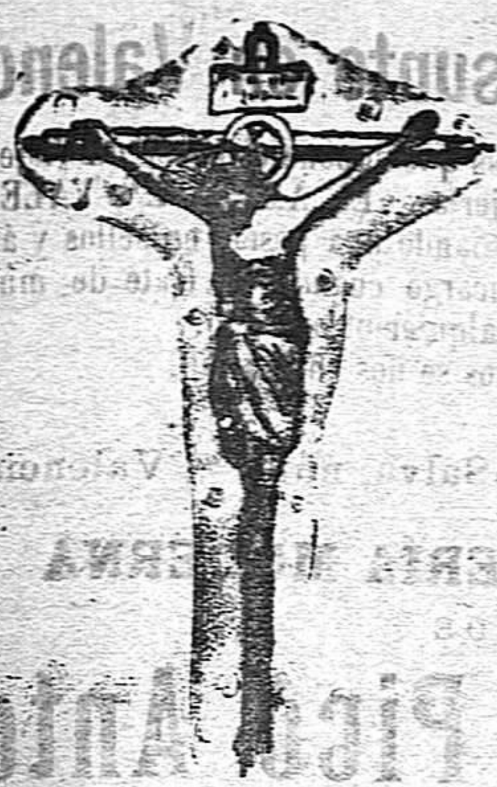
EL SANTO CRUCIFIXO DE SAN AGUSTIN EN SEVILLA

La antiquísima imagen que reproducimos en este dibujo venerase en Sevilla, en la iglesia parroquial de San Roque, y recibe el título por el que generalmente es conocida, del extinguido convento de San Agustín, donde, según algunos historiadores, existió desde 1314, fecha en que fué hallada en un sótano ó cueva cerca del referido convento.