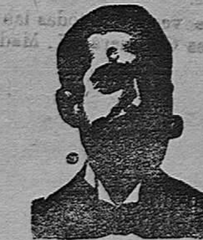
A. SALVATI COSTANZI CALLE DIPUTACION, 435 BARCELONA

Miles y miles de celebridades médicas, después de una larga experiencia, se han convencido y certificado, que para curar radicalmente los estreñimientos uretrales (estrechez), flujo blanco de las mujeres, arenillas, catarro de la vejiga, cálculos, retenciones de orina, escozores uretrales, purgación reciente ó crónica, gota militar, y demás infecciones genitourinarias, evitando las peligrosísimas sondas, no hay medicamentos más milagrosos que los Confites ó Inyecciones Costanzi.