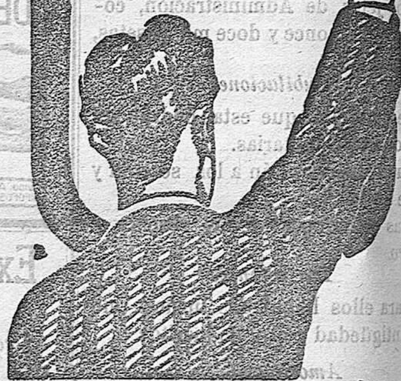
PREPARADO EN FARMACIAS Y QUÍMICAS

y los Médicos le llaman el REMEDIO DE LOS DÉBILES