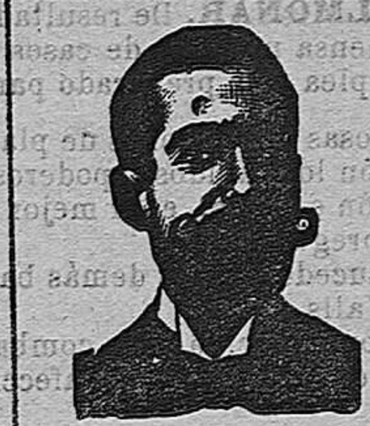
A. SALVATI COSTANZI CALLE DIPUTACIÓN, 435 BARCELONA

La fuerza motriz más económica. Motores «BENZ» á gas pobre, con generador que produce este gas del carbon de antracita. Consumo máximo por hora y caballo: 600 á 800 gramos de carbon de antracita.