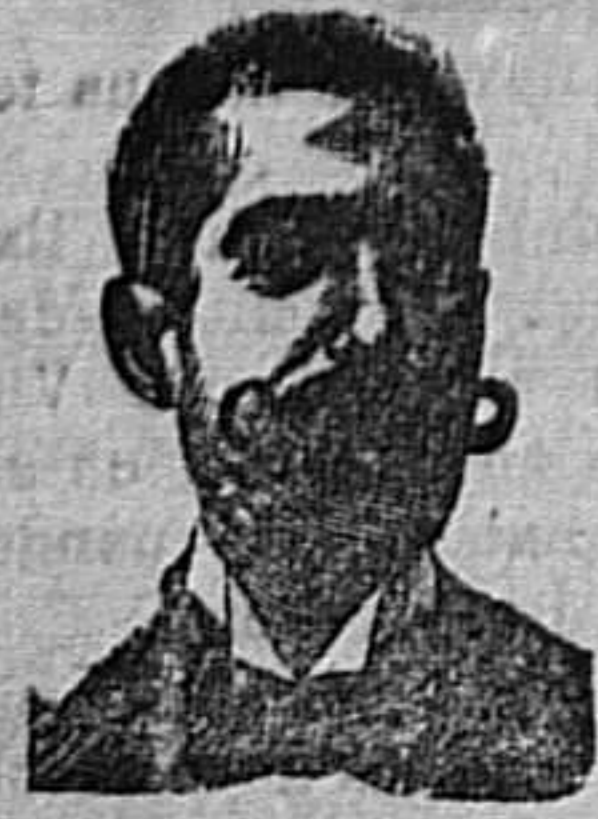
A. SALVATI COSTANZI Calle Diputación, 465.-Barcelona