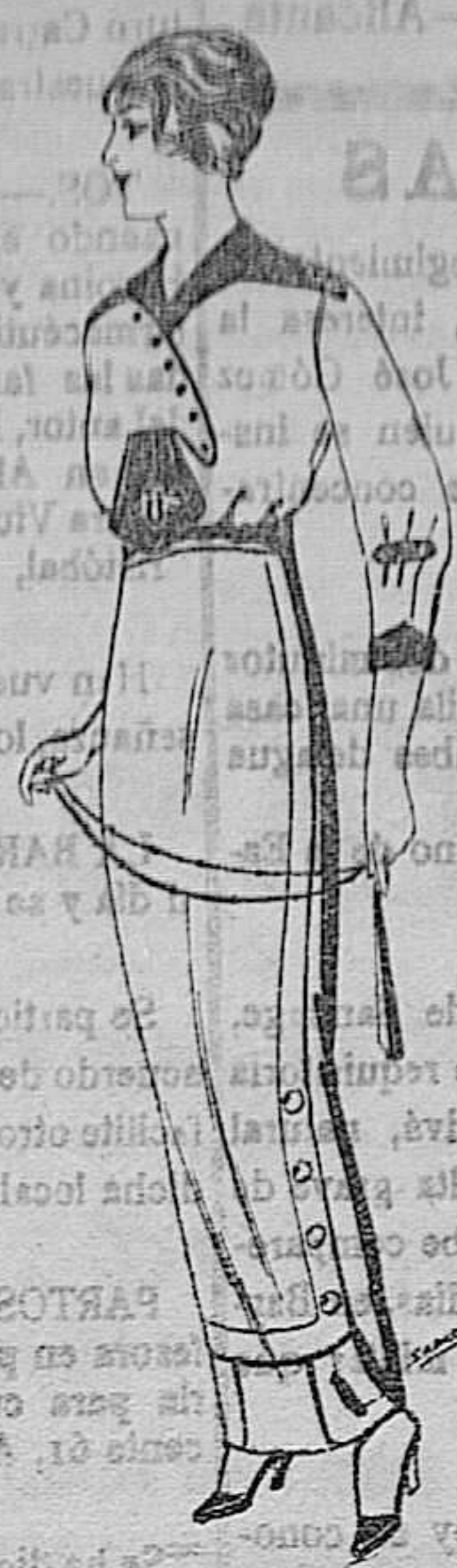
Blusa de seda blanca y colores, adornos bordados de ptas. 25. Faldas de lana de ptas. 11 á 22

Ropas confeccionadas para Caballero y niño y artículos de la Temporada